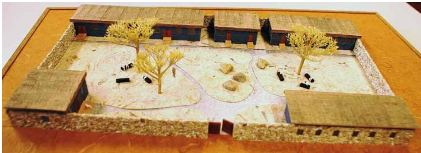
Maquette van Timo's Girls School die gebouwd is in Shah Mansoor, Afghanistan

in de Boskapel lopen. Volgens haar lijkt de manier waarop hier gevierd wordt op de manier van vieren binnen de krijgsmacht. Voorgaan bij vieringen en het voeren van pastorale/levensbeschouwelijke gesprekken worden haar belangrijkste leeropdrachten.