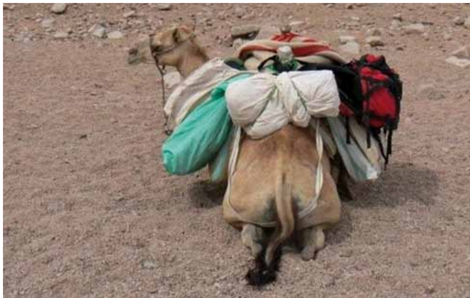
Asfar beladen

Reageren? info@hadiyareizen.nl ; meer informatie over wandelen in de woestijn zie: www.hadiyareizen.nl