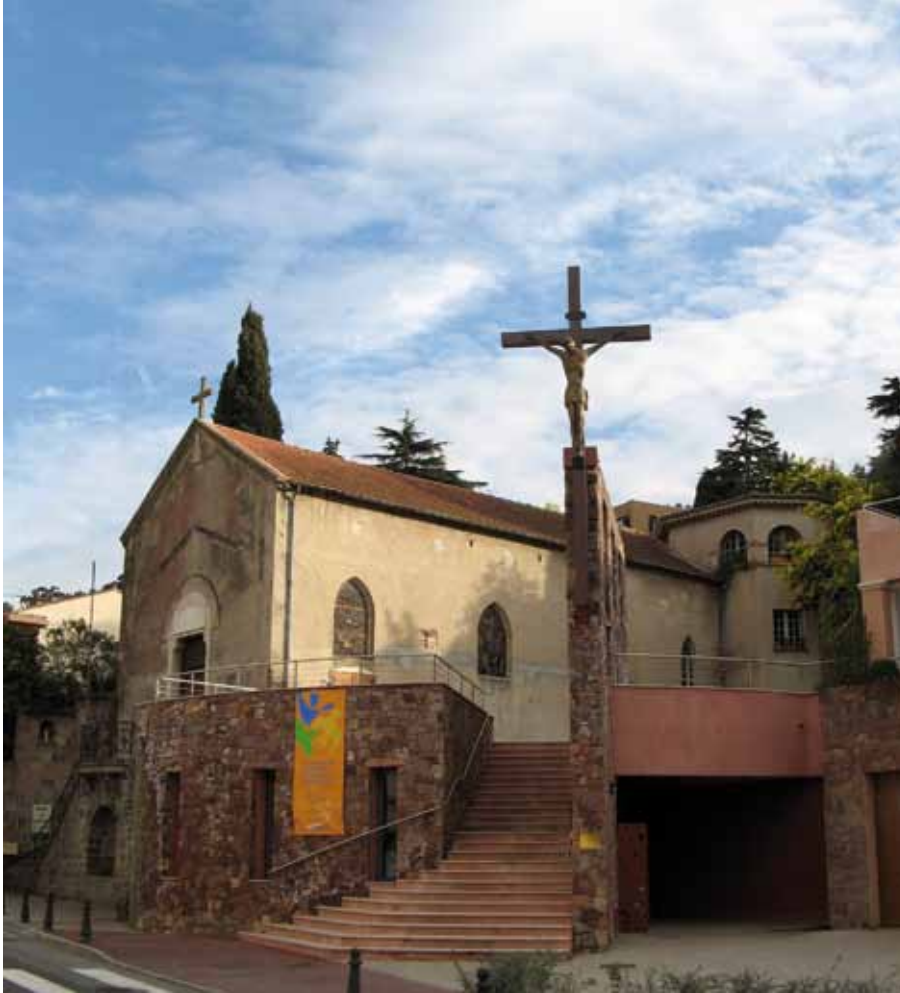
Het klooster in Théole sur Mer

ding op te kunnen bouwen met de gelovigen. Maar haar visie maakte niet veel indruk op de mannen. Toen ze met haar zeventigste verjaardag met pensioen werd de parochie dan ook samengevoegd met vijf andere parochies, waarvoor vier priesters beschikbaar zijn, die ondersteund worden door actieve pastorale werkgroepen, die feitelijk het hele pastorale takenveld voor hun rekening nemen.