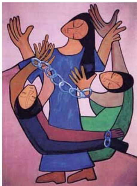
Slavernij. Illustratie: Ludwina Foolen

De reflecties in deze overwegingen werden geschreven voor Braziliaanse religieuzen door de Nederlandse karmeliet Carlos Mesters. Hij is exegeet en werkt als missionaris in Brazilië. Ook daar zijn religieuzen actief in de strijd tegen mensenhandel. De gebeden en teksten komen uit de hele wereld. De keuze en de vertaling van de gebeden, selectie van de liederen en samenstelling van de vieringen wer-