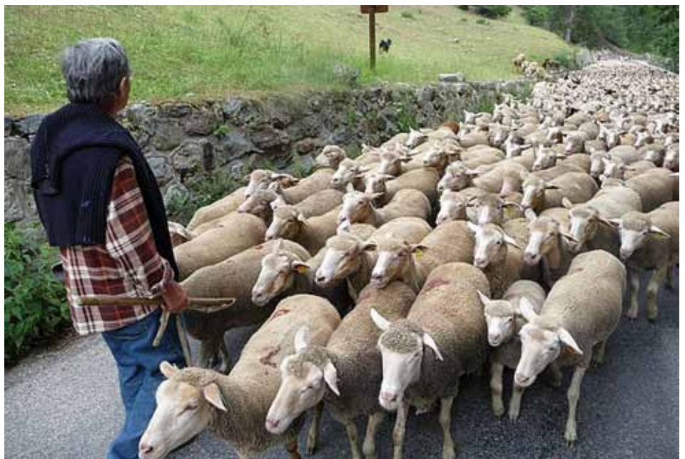
Een herder is vertrouwd met zijn schapen en zij met hem (Johannes)

Ik stel herders over hen aan die ze hoeden zodat ze niet meer verloren lopen of in vrezen en beven moeten leven. (Jeremia 23,1-4)