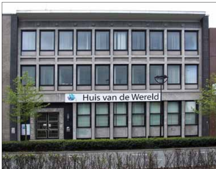
Huis van de Wereld aan de Spoorlaan in Tilburg met daarin het MST en de Huiskamer

Ernstige gesprekken volgden. Dré werd bevorderd tot assistent-vrijwilliger in de rol van portier. Nietsvermoedende bezoekers werden nogal eens overrompeld begroet met een uitgestoken - viezige - hand. Goedwillende vrijwilligers organiseerden samen met Dré een expeditie