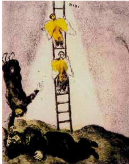
Droom van Jacob, Jacobs ladder Marc Chagall 1887-1985

Een visioen is een waarneming die innerlijk en subjectief kan zijn, maar ook ingegeven kan zijn door de zintuigen of een verbeelding van het verstand. Volgens Numeri 12, 6-8 sprak God tot de profeten in dromen en visioenen. Afgaande op de beschrijvingen bevatten de visioenen van