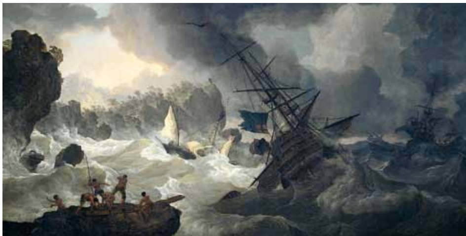
Hendrik Kobell Schipbreuk (1775) Deel, Olieverf op doek, Rijksmuseum Amsterdam

Henk de Roest En de wind steekt op . Meinema 2005, p.205-221