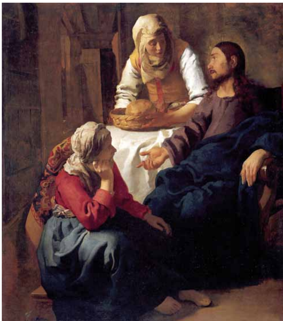
Johannes Vermeer Christus in het huis van Martha en Maria . National Gallery of Scotland, Edinburgh

God, het hoofd koel en helder kom ik bij u terug. Als u met me mee wilt lopen, hoop ik op uw luisterend oor en uw hand die me vasthoudt. De problemen met de Kerk, die zich draagster van uw boodschap van liefde weet, worden steeds groter. Al wat ik toejuichte in het schuchter streven van Johannes XXIII naar een hedendaagse Kerk met ruimte voor het geweten van de gelovige wordt weloverwogen en nadrukkelijk teruggedraaid naar starre institutionele wettische regels. Die heeft Jezus toch nooit zelf verkondigd! Ze zijn twintig eeuwen naar de geest van de tijd stukje bij beetje ex cathedra ingesteld.