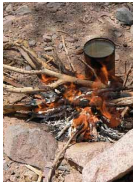
Dit hout is goed, maar dat kun je beter laten liggen.