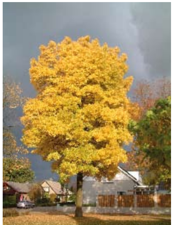
Herfstbloesem (© Foto: Peer Verhoeven)