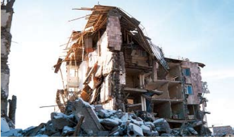
De verwoeste flat waarin Cajane Gjunashjan woonde tot de aardbeving van 7 dec. 1988

Uit de vele gedichten, gedachten en impressies die De Roerom worden toegestuurd maakt de redactie een keuze.