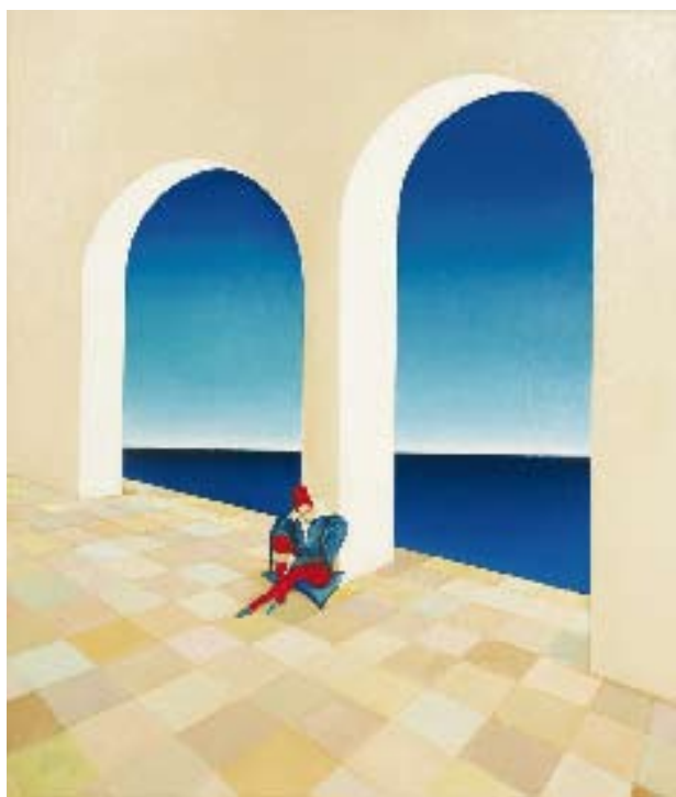
Leegte. Schildering van Jos Brink naast zijn tekst Leegte en Gemis