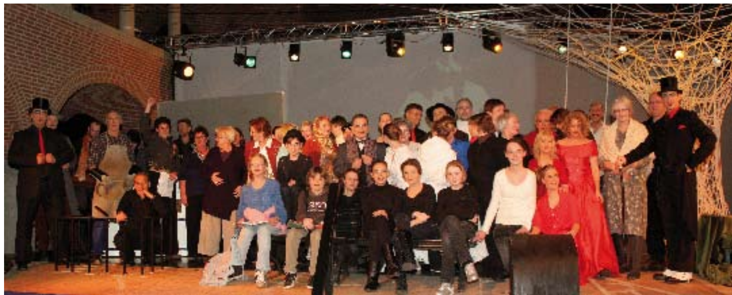
Alle deelnemers van musical Goudkoorts