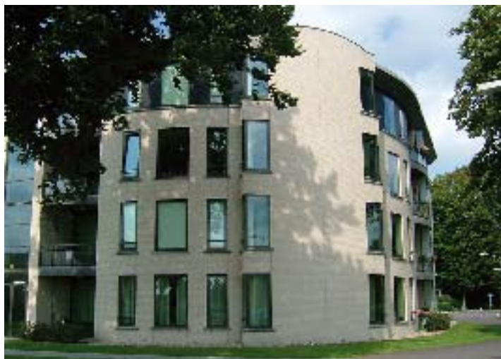
Het nieuwe onderkomen van de paters van Scheut in Teteringen

De missionarissen - zeventigers en tachtigers - hebben veel toekomst achter zich liggen. Zij blikken terug op hun leven en denken na over hoe zij 'hun steen in de rivier hebben gelegd' en hoe dit al of niet de loop van de rivier heeft veranderd. Het is niet vreemd dat Van Bronkhorst hieraan aandacht besteedt in zijn film.