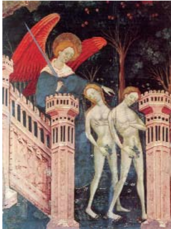
Ramón de Mur, Verdrijving uit het aardse paradijs , 1402-1412

De hele financiële crisis en de stagnatie van de economie die we nu meemaken, zou je kunnen herleiden tot hoogmoed en arrogantie. De agressie-oorlogen die George W. Bush ondernam tegen Afghanistan en Irak zijn te zien als een overreactie op de terroristische aanvallen op de Verenigde Staten. Door de krapte op de financiële markt die mede door de geldverslindende oorlogsmachine ontstond, werden de banken terughoudend om elkaar geld te lenen en hypotheeken te verstrekken. De kredietcrisis, mede hierdoor ontstaan, heeft vooral gevolgen voor de huizenmarkt. Plotseling wreekt zich, dat