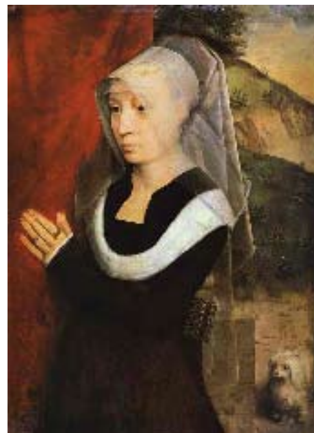
Hans Memling, Portret van een biddende vrouw ca.1485. Olieverf op paneel. Museum of Fine Arts, Budapest, Hongarije

Het is de kunst om de toewijding, de kawwana, levend te houden. Gelukkig zijn