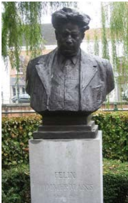
Borstbeeld van Felix Timmermans in Lier (B)

Wij zijn op aarde om hier en hiernamaals gelukkig te zijn. (Catechismusleer)