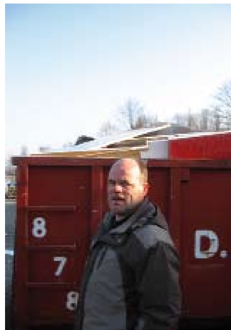
Henk op locatie!