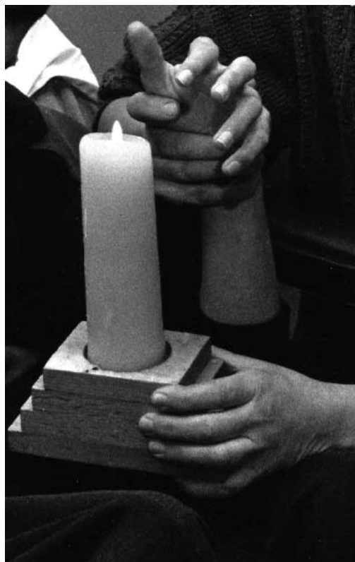
Vieren is beleven

Ik werk veel met cliënten met een ernstige meervoudige beperking. Dit zijn cliënten die