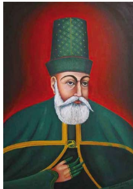
Haci Bektash Veli

ne die licht op deze weg mag werpen'. De leerstellingen en filosofie van Haci Bektash horen bij de alevitische denk- en leefwijze. Veel van zijn uitspraken hebben een belangrijke plaats gekregen in de opvattingen en het dagelijks leven van de alevieten. Een tweede zeer vereerde man is Yunus Emre, tevens een beroemd dichter. Zijn naam prijkt op vele Turkse moskeeën en winkels, ook in Nederland.