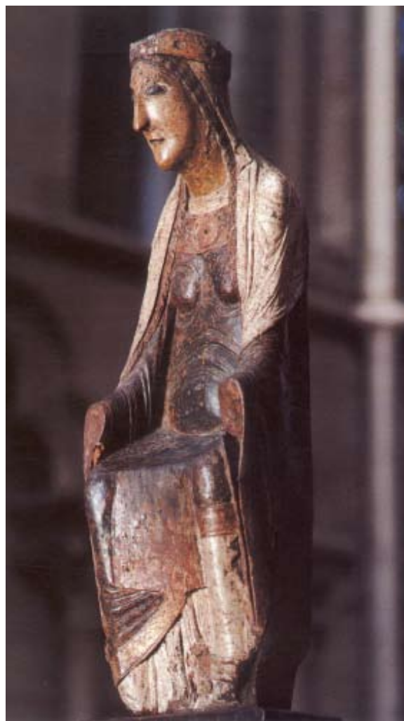
Notre-Dame de Espoir (Dijon Frankrijk)

Ga en blijf daarom met ons Gij God en Goed voor tijd en eeuwigheid.