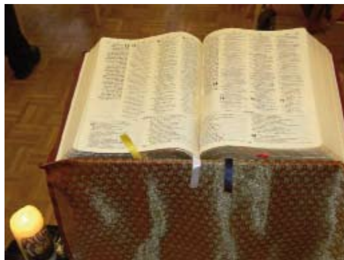
De Biblia Polyglotica. door de paus geschonken aan de deelnemers van de laatste bisschoppensynode

In gesprekken in de wandelgangen van het symposium werd me duidelijk dat niet alleen in Nederland een dergelijke terugslag aan de orde is. In heel Europa vindt een grote herschikking plaats, alsof een multinational gereorganiseerd moet worden. De volkskerk is voorbij; de kerk als beeld en maatschappij bepalende instantie is