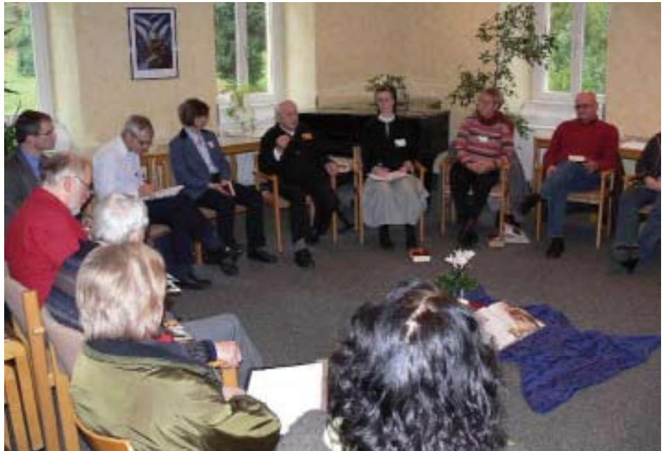
Te gast bij 'bijbel delen'.

Begroeting - bewust worden van Jezus' woord 'Waar er twee of meer in mijn naam bijeen zijn ben ik in hun midden' - iemand spreekt een eigen gebed. Het Woord aanhoren - iemand leest een bijbelfragment, bijvoorbeeld de lezing van de komende zondag, maar een ander gedeelte kan even-