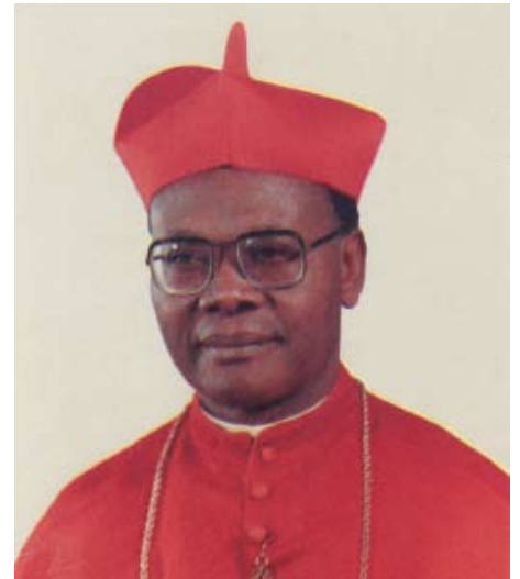
Kardinaal Malula *17 dec. 1917 - † 14 juni 1989