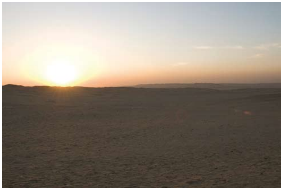
De aarde was woest en leeg...

(Lied gezongen en de zevende bloem bij het kruis)