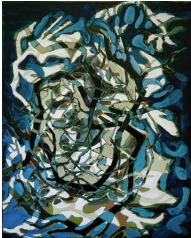
Doornkroon, schilderij van Sylvia Thijssen, Breda

God trekt zich het lot van elk mens aan. Maar niet alleen individuele mensen wachten in diepe duisternis op licht. Hele volken raken onder de voet gelopen. Landen worden bezet, mensen maken elkaar krijgsgevangen. De een wil over de ander heersen en samenleven loopt uit op conflict en angst voor verlies van rijkdom en macht. Wat waren de Israëlieten in Egypte