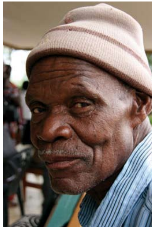
Door het leven getekend