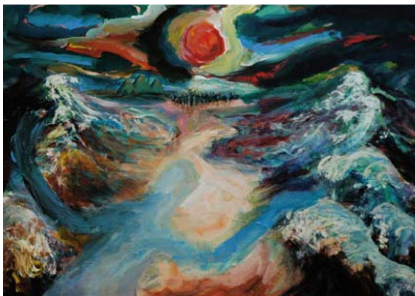
Mozes, schilderij van Sylvia Thijssen, Breda

Ook in de liturgie speelt de symboliek van de doortocht een grote rol. Dat geldt niet alleen voor het grotere kader van het liturgisch jaar, waarin de vieringen zijn opgenomen, maar ook voor elke viering afzonderlijk. Die dubbele betekenis van het bredere kader en de concrete nabijheid wordt goed in beeld gebracht door de advents-