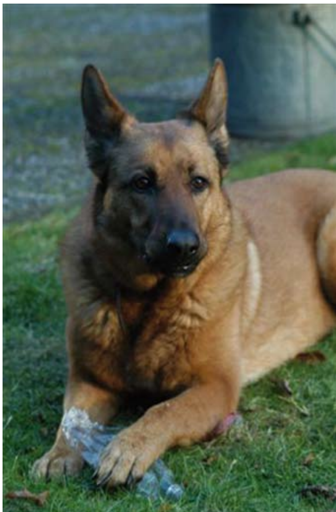
Een dagje gewoon mee

Samen met nog een vijftiental cursisten zit ik op een cursus, die handelt over de ontwikkeling van de filosofische roman. Rituelen was het eerste verplichte nummer. Tijdens de uitvoe-