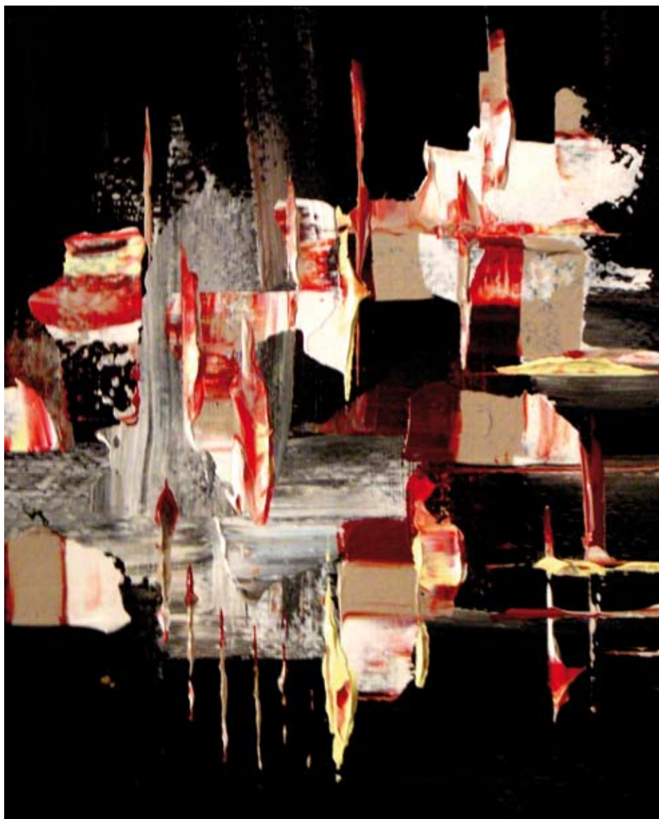
Requiem, illustratie van Iris van Haaren

Lang heeft ze gedacht dat iedereen dat ontheemde gevoel had. 'Dat blijkt niet zo te zijn. Veel mensen zitten in een andere wereld dan ik. Ze hebben verborgen agenda's en richten hun leven zo in dat ze daar uitkomen waar ze willen. Ze voelen zich er prima bij. Ik kan daar niet mee omgaan. Ik kijk weinig televisie; het is vaak maar onzin wat erop komt. Ook spaar ik niet, want hoe kan ik het over mijn hart verkrijgen om geld weg te zetten, terwijl zoveel anderen het nodig heb-