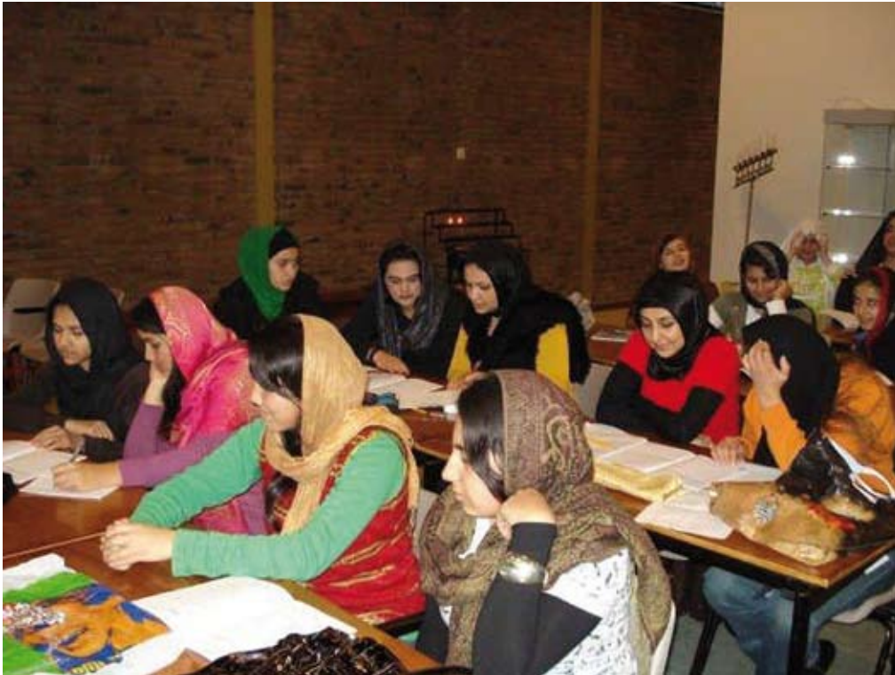
Afghaanse les

Somalië en Afghanistan, katholieken en protestanten uit Tilburg, de Antillen en Suriname nadenken over wat hen bindt. Zó samenwerken om van Tilburg-Noord een wijk met potentie en mogelijkheden te maken.