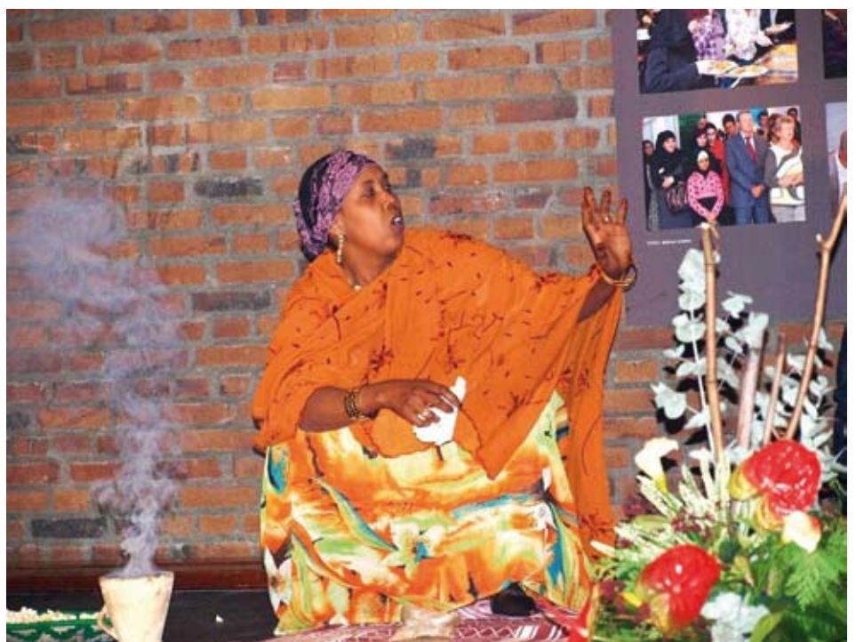
Somalisch theater (© Foto: Thea van Blitterswijk)

In het laatste jaar van voorbereiding zochten verschillende groeperingen het Ronde Tafelhuis op. Welke kansen en mogelijkheden liggen hier om met elkaar verder te gaan? Vaak ging het om groeperingen die op zoek waren naar ruimte voor hun eigen activiteiten. In de voorgesprekken werd steeds opnieuw benadrukt dat aansluiting alleen mogelijk was, wanneer men ook bereid is om samen met de andere gebruikers de schouders onder het Ronde Tafelhuis te zetten. En die gedachte sloeg aan! Zo bleek het mogelijk om van de opening van het centrum op 21 november een grandioos feest te maken. In goed overleg kwamen de verschillende groeperingen samen en brainstormden erop los op zoek naar gemeenschappelijke activiteiten. Daaraan wordt met veel enthousiasme en volle inzet gewerkt. We zien nu bijeenkomsten waar leden van de Ghaneese gemeenschap, moslims uit Marokko,