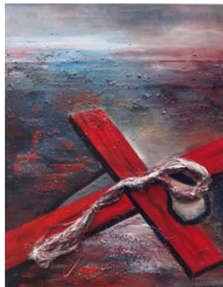
Achtste statie: Genageld

Rinus Roland Wandelgids voor rolstoelgebruikers. Wandelend genieten dichtbij huis. Uitgave van Eoscentra 2008; ISBN 978 907 536 278 7; € 12,95