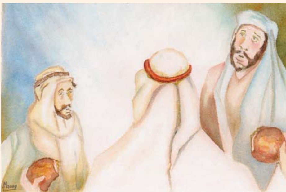
Illustratie: Maarten Lemmers o.f.m.