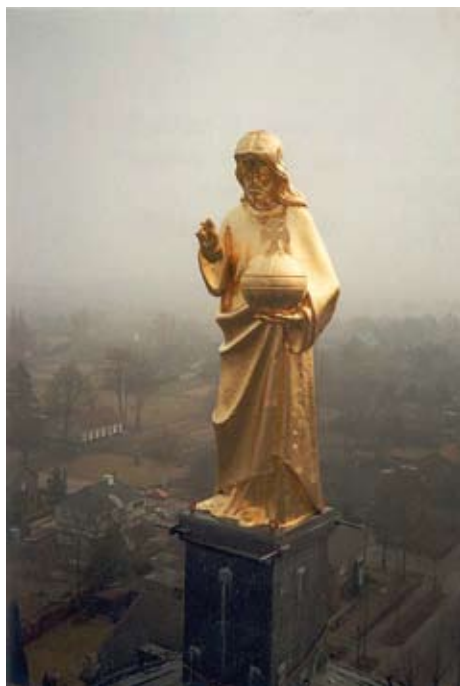
Christusbeeld op 40 meter hoge koepel