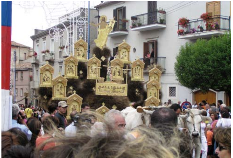
Jelsi, provincie Campobasso (regio Molise) Italië, Festa del Grano kruiswegstaties en de verrezen Heer, gemaakt van graan en graanafval

zichzelf zijn weggevlucht. De ontgoocheling ligt hen als een steen op het hart. Wie zal die ooit nog weggrollen? Zij zijn in een afgrond gevallen. Ze zitten, volks gezegd, 'in de put' en vrezten er nooit meer uit te komen. De Emmatীগangers - hun verhaal is momenteel mateloos populair - zijn van deze ontgoocheling de prototypes.