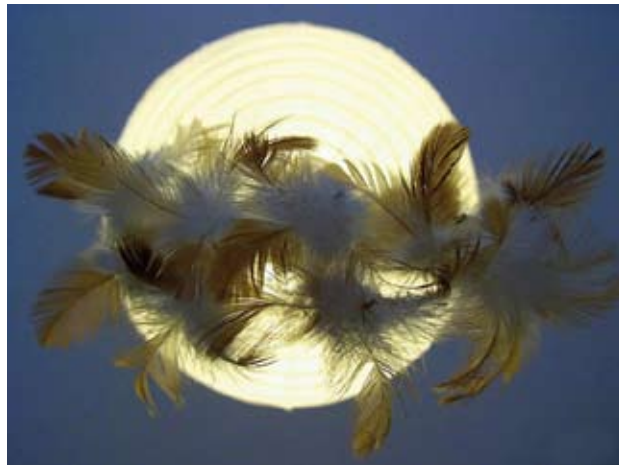
Dromenvanger hangend onder een lamp

Blijven dromen over dankbaarheid die je uit verwondering haalt