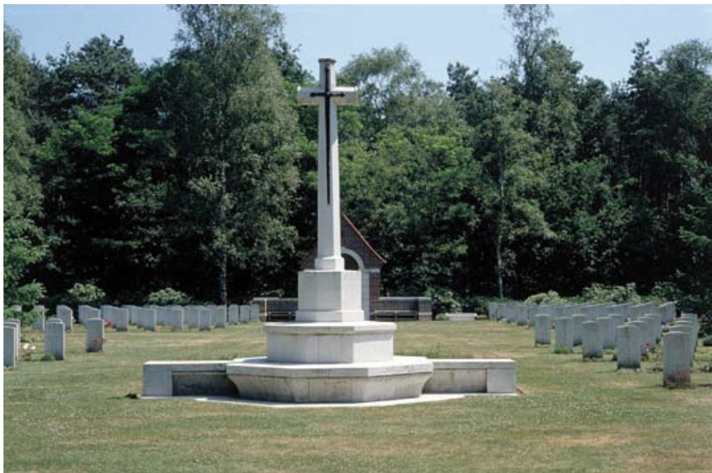
Overloon, Brits ereveld. Ontwerp Offerkruis: Sir Reginald Blomfield

In weerwil van de latere tradities die het lichamelijke ondergeschikt maken aan het geestelijke, lijken kruisiging en verrijzenis als symboliek te willen uitdrukken dat er een verwevenheid bestaat tussen het transcendente en het alledaagse. Het mysterie van het leven is volledig in een mensenleven ingeweven en maakt iedere mens uniek, de moeite van het herinneren waard. God's greatest gift is remembrance staat er op een Engels oorlogsgraf in Overloon, maar ook bestendig tot over de grenzen van de dood heen.