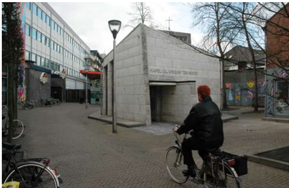
Op het pleintje voor de O. L. Vrouw ter Nood-kapel (achterzijde Schouwburg Promenade) wordt vrijdag 15 mei voor de eerste keer in Tilburg Maria Zingt gehouden

De kapel is een modern ontwerp van de Tilburgse architect Jos Schijvens. Binnen worden de Tilburgers herdacht die omgekomen zijn tijdens de Tweede Wereldoorlog. Elke dag wordt een pagina van het gedachtenisboek omgeslagen. In de hectische binnenstad is het een oase van rust. Het bezoek is hoog. Elke dag wordt in de kapel een mis gelezen. Zeker die op zaterdagavond is druk bezocht.