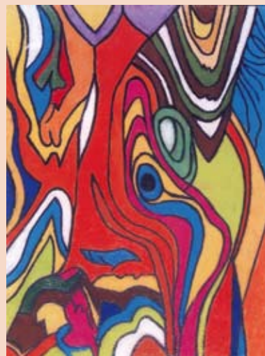
Illustratie: Piet Peeters cssp

Dit betoog is niet meer dan een denkoefening. Het is duidelijk dat de christelijke kerken moeilijke en soms uitzichtloze wegen bewandelen, waarvan velen vermoeden dat het doodlopende wegen zijn. Of dat ook zo is zal in de toekomst blijken. Maar soms moet je nieuwe wegen durven verkennen, nieuwe ontdekkingstochten buiten gebaande paden durven ondernemen. Dit zijn we zowel aan het verleden als aan de toekomst verplicht.