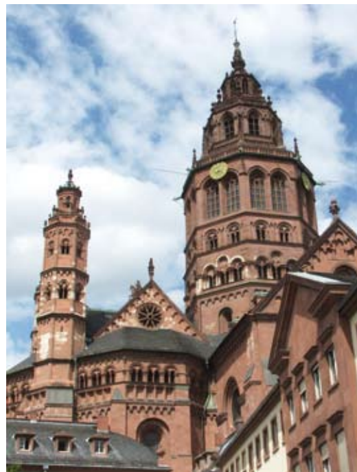
De St. Stefansdom van Mainz