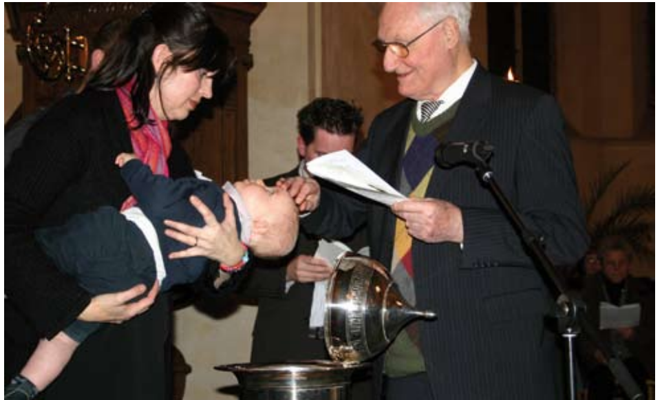
Je kind dopen: erkennen, belijden en bevestigen dat dit leven heilig en te heiligen is.

In een kind wordt het diepste en liefste wat in mensen leeft vlees en bloed.