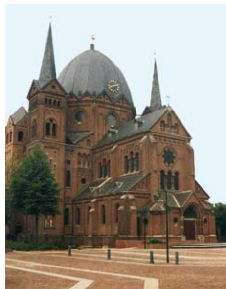
Neoromaanse Koepelkerk Lierop, Architect Carl Weber

Daartegenover zou je ook een andere visie kunnen ontwikkelen, een visie die het heden serieus neemt en niet tot elke prijs vasthoudt aan het verleden. In deze visie kan het afnemend aantal priesters en de toename van pastoraal bewogen en goed toegeruste leken - onder wie opvallend veel vrouwen - uitgangspunt worden van een nieuw kerkbeeld, - een kerkbeeld, waarin de vrouw een grotere rol speelt en waarin de plaatselijke geloofsgemeenschap serieus wordt genomen. In deze visie zijn kleinschaligheid, nabijheid en menselijke maat de sleutelwoorden. Dus vragen wij met aandring dat het bisdom niet alles concentreert rond enkele gewijde priesters, maar juist de plaatselijke ge-