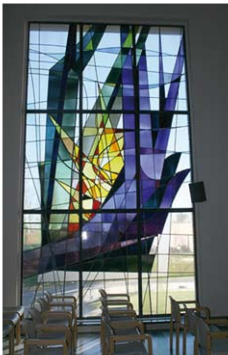
Glasraam kapel ziekenhuis St. Trudo, België

Nu worden de meeste van de genoemde behoeften en mogelijkheden momenteel wel onderkend en men probeert daar zo goed en zo kwaad als dat kan ook vorm aan te geven. Zo hangt het AMC vol mooie kunstproducties. Ook worden er regelmatig kunsttentoonstellingen georganiseerd, die in de ruime gangen daar goed tot hun recht komen. In het VUMC wordt studie gemaakt van de speciale behoeften van mensen van andere culturen op het gebied van voeding, accommodatie en leefgewoonten. Op de transfer-afdeling, waar revalidatie belangrijk is, worden dagelijks activiteiten en zandsporten georganiseerd en de kinderafdeling is omgetoverd in een sprookjesland. Hoewel de afdelingen geestelijke verzorging van beide genoemde ziekenhuizen wel aan dit soort zaken meewerken, zijn die zelf nog traditioneel georganiseerd en bestaan uit verschillende dominees, aangevuld met een imam en een rooms-katholieke priester; op het AMC verder met enkele humanistische raadvrouwen. Met de nieuwe inzichten op het gebied van geestelijke verzorging zou het consequent zijn om de overkill aan theologen wat terug te brengen en ook andere relevante disciplines zoals psychologie, agogie, kunst en entertainment aan de staf toe te voegen of bij gelegenheid in te huren. Deze formule is niet minder evangelisch dan de vorige en geeft meer aandacht aan de verschillende dimensies van het welzijn van mensen.