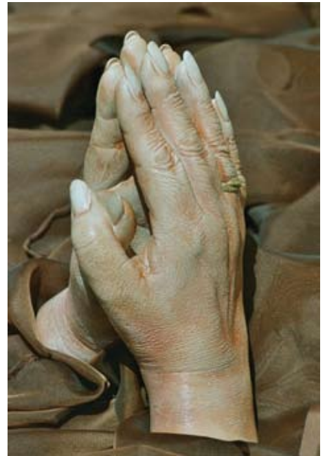
J. Rubach Betende Hände , Airbrush

Er is dan ook een prachtige naam voor deze vrouw bedacht, ingegeven door de naam van de zus van priester Aäron: Mirjam. In Exodus 15,20 staat: 'Daarom nam ook de profetes Mirjam, Aärons zuster, haar tamboerijn in de hand en alle vrou-