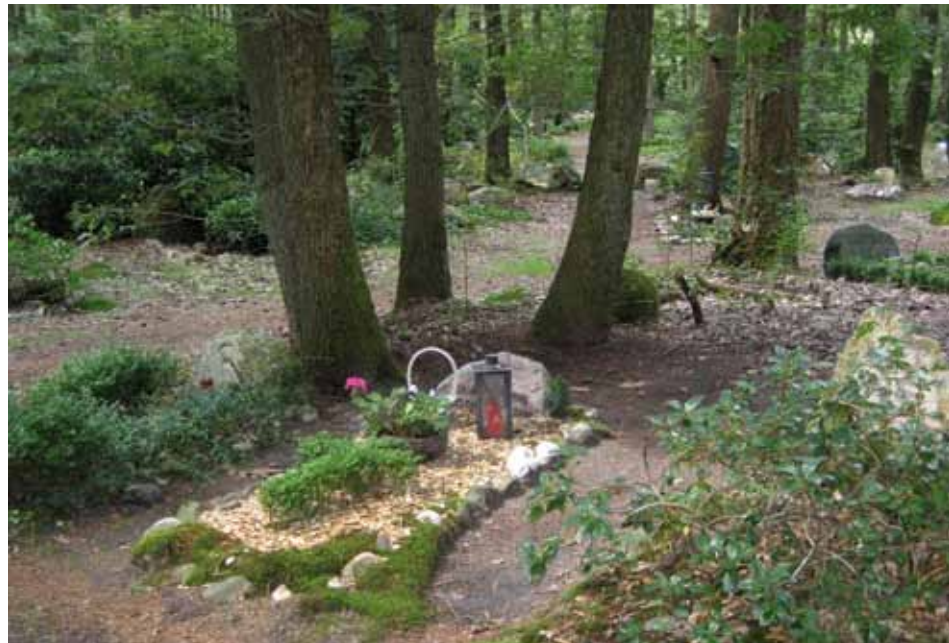
Natuurbegraafplaats Assel bij Hoog Soeren

De Nacht der Zielen wordt ook zo gevierd