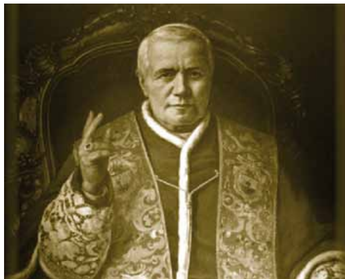
Paus Pius X geboren als Giuseppe Melchiorre Sarto † 1914