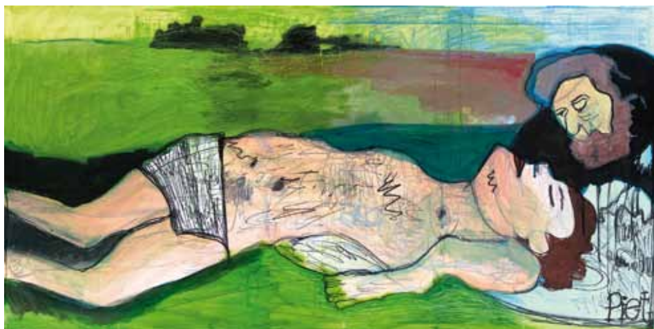
Piet Schopping De barmhartige Samaritaan te zien op de expositie Wonder boven wonder. Zie pagina 7.

Jezus ging met tollenaars en zondaars om. De farizeeën en schriftgeleerden die een vrouw bij hem brachten zeiden van haar dat ze overspel had gepleegd en volgens de wet gestenigd moest worden. 'Heer, wat vindt u?' Jezus schreef met zijn vinger in het zand, keek op en zei: 'Wie van jullie zonder zonden is werpe de eerste steen.' En weer schreef hij in het zand.