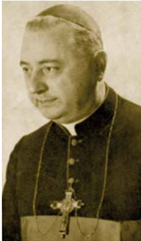
Italiaans Lazarist en aartsbisschop Annibale Bugnini, C.M. † 1982

Volgens de begeleidende brief is het Motu Proprio bedoeld als een tegemoetkoming aan de Pius X Broederschap en aan anderen die moeite hebben met de nieuwe liturgie. Het betreft met name een kleine minderheid van katholieken die zich verzetten tegen de liturgische vernieuwingen van Vaticanum II. Al tijdens het concilie was er verzet van een kleine groep, dat uitging van kardinaal Ottaviani en kardinaal Bacci, de latinist van het Vaticaan. Zij constateerden een kortsluiting met het Concilie van Trente. In 1967, enkele jaren na het Tweede Vaticaans Concilie, verscheen een pamflet van de Italiaanse journalist Tito Casini met een voorwoord van kardinaal Bacci onder de titel La tunica stracciata , Het verscheurde kleed, waarin kardinaal Lercaro, voorzitter van de raad tot uitvoering van de Constitutie over de Liturgie, als de nieuwe Luther