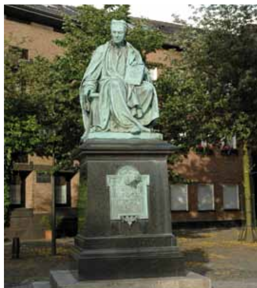
Thomas a Kempis, standbeeld in Kempen (D)

De verzekering dat je kunt liefhebben laat onverwachts nieuw bloed door je aderen stromen. Het geeft zelfvertrouwen, brengt je in beweging. In de Handelingen van de Apostelen is te lezen hoe zowel Paulus als Barnabas als een kind zo blij zijn met deze medaille van liefde. Ze rennen om iedereen in de vreugde van die laatste verzekering van de stervende Jezus te laten delen. Lucas brengt dat in zijn Handelingen knap in beeld. In een paar verzen bereis je met die twee zowat de hele wereld. Ze verkondigen