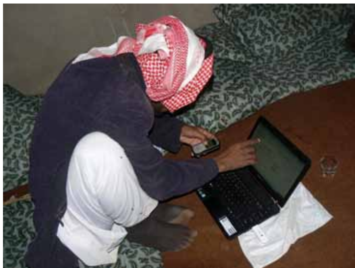
Met modemstick verbinden. Sami aan de slag

De meeste bedoeïenen die ik ontmoet zijn niet erg geïnteresseerd in wat er buiten hun leefgebied gebeurt. De regio gaat nog net. Van daarbuiten weten ze genoeg, denken ze. Daar komen de toeristen vandaan en die zijn allemaal rijk. Die wonen in grote