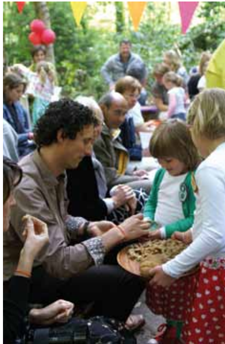
'In onze eigen bos-kapel'