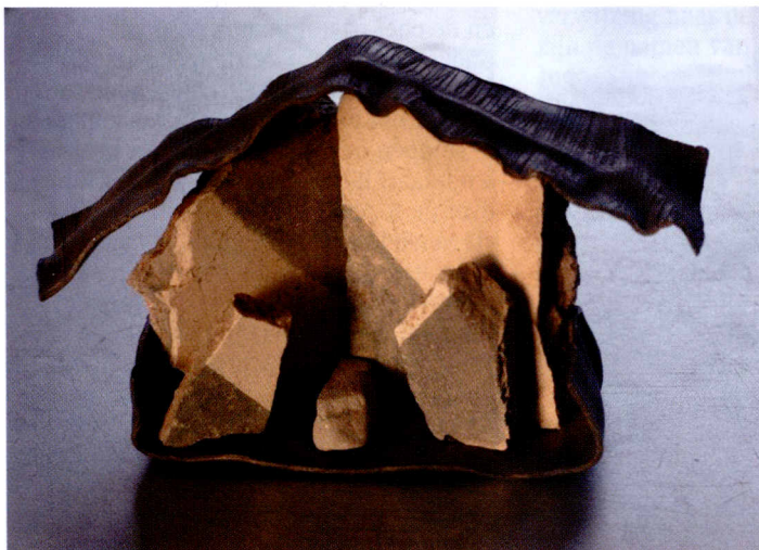
Gebouwd met puin en afval bouwmaterialen in Rome gevonden (Bouwsels: Jeanne van Leijsen)

Op moeilijke ogenblikken, wanneer ik geconfronteerd word met ziekte, dood of tegenslag, keer ik terug naar mijn Maya-geloof, te