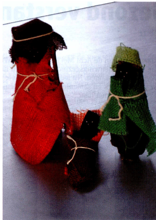
Half verbrand hout gevonden op het strand van Vlissingen aangekleed

kunde tot koning gekroond en geprobeerd het zonder religie te stellen. Dit heeft grote zegeningen gebracht en ons verlost van de bevoogding door de kerken. Maar tegelijk zijn wij onze oriëntatie kwijt, zijn we ontheemden geworden op een verdwaald planeetje in een leeg heelal.'