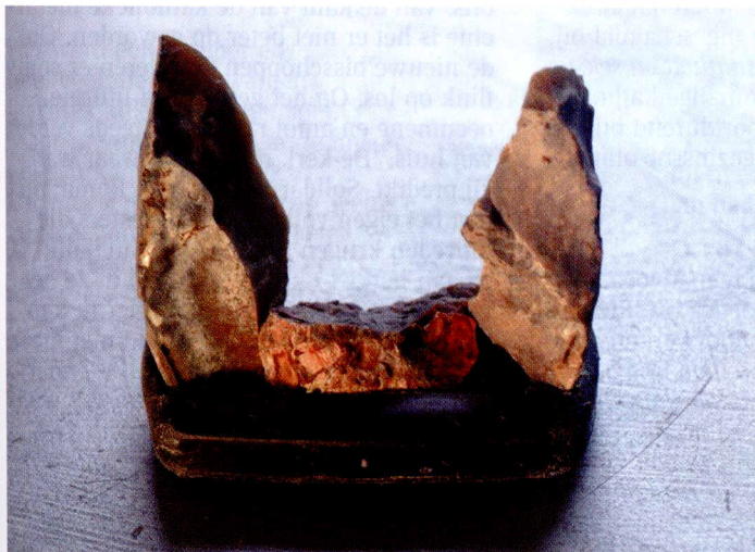
Drie stukken steen opgeraapt op het Duitse grafveld van WO I in Vladslo West Vlaanderen