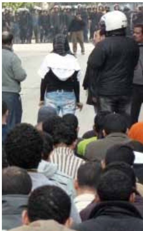
Protest op het Tahrirplein in Caïro

Je bent geboren en opgegroeid binnen een dictatoriaal systeem en je weet niet beter dan dat er geen vrijheid van spreken en organiseren bestaat. En toch heb je van binnen weet van een andere werkelijkheid, van vrije ruimte; de drang om je mening te vormen en gegroeide inzichten die in de jouw omgeving niet geoorloofd zijn en afgestraft worden, te uiten. Vanuit die verborgen bron in jezelf vindt gewetensvorming plaats. Natuurlijk gaat gewetensvorming makkelijker als je omgeving meedenkt, aanstuurt, maar het kan kenmerkend ook zonder. In de afgelopen jaren zijn die van binnenuit gegroeide werkelijkheid en inzichten en is dat gevormde geweten bevestigd en versterkt door communicatie met andere landen, leeftijdsge-