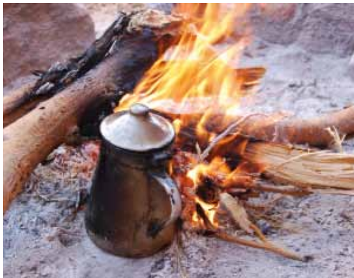
'En zo zitten we rond het vuur, urenlang ...'

Wie mij verder wil volgen kan op mijn blog kijken: http://marionmeulenbroek.wordpress.com . Elke maand of vaker een nieuw verhaal. Wie mee wil naar de woestijn kan nadere informatie vinden op mijn website of via e-mail aanvragen. Van 11-18 november dit jaar gaat de culturele reis, die langs het Katharinaklooster voert, langs islamitische heiligdommen, oases en de woestijn. Kortom: bedoeïenencultuur en islam van binnenuit. Tevens kan Petra bezocht worden. Nadere info hierover tevens in bezit van de redactie.