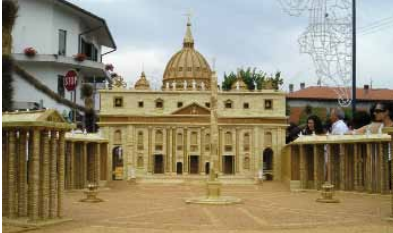
De St. Pieter van koren op het Festa del Grano 2005 in Jelsi, De Molise/Italië

In 1997 schreef de toenmalige nuntius in Ierland een brief aan de Ierse bisschoppen. Daarin stond de reactie van de Congregatie - Vaticaans 'ministerie' - voor de Clerus op een intern rapport van de Ierse bisschoppen inzake het kindermisbruik in diverse bisdommen. Het Vaticaan betoogt nu dat voor dat document nooit het stempel recognito is gevraagd - en ook niet ongevraagd is afgegeven! - waardoor het document volgens canoniek recht een officiële status zou hebben gekregen. Met andere woorden: het bleef een intern stuk van