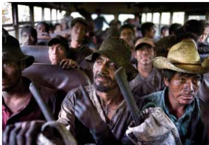
Suikerrietkappers op weg naar huis, velen van hen zijn Maya's uit het bergland

Teksten van auteurs als Ignatius van Antiochië, Afrahat, Maximus Confessor, Izaak de Syriër e.a. worden gelezen en besproken. De eerste bijeenkomst heeft al plaatsgevonden. Verder de donderdagavonden 13 en 27 oktober, 17 november en 15 december van 19.45 tot 22.15 u. Franciscushuis, Van der Does de Willeboissingel 11, 's-Hertogenbosch. Bijdrage € 60,- (incl. reader). Aan-