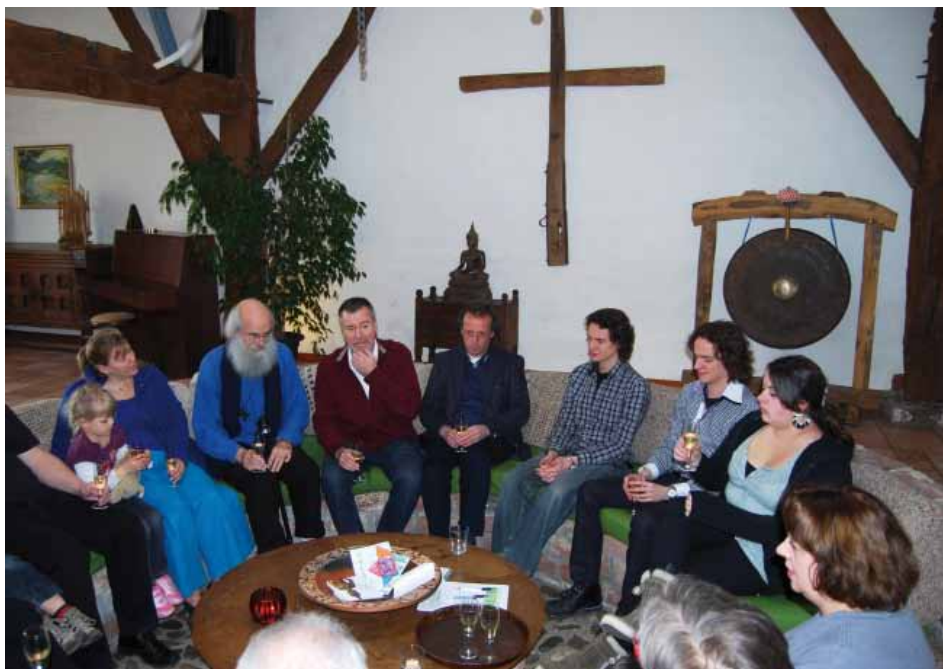
Nog steeds een vitale gemeenschap

Het Hoge Steen , Schaapsdijkweg 20, 5453 SE Langenboom (0486) 43 15 26