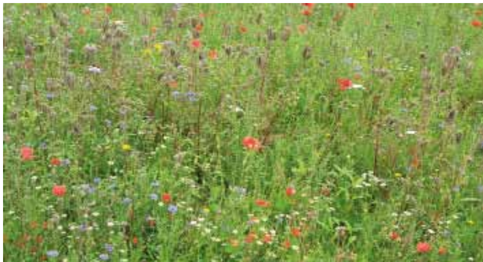
Het Europa van de toekomst zo veelkleurig als een veldboeket

lisering die zich steeds meer verspreidt en mensen het gevoel geeft tot één groot menselijk geslacht te behoren. De solidariteit is een wonderbare verbondenheid die door de universele verspreiding van techniek en wetenschap de mensen steeds dichter bij elkaar brengt. De multi-