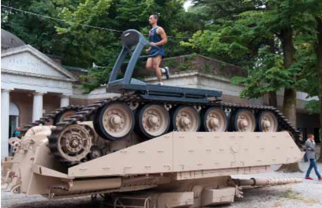
'Dan zullen zij hun zwaarden tot ploegscharen omsmeden', Biennale

kelijkheid van het goddelijke. De kunst draagt eraan bij om de werkelijkheid rondom de mens anders te laten zien, kleur te geven of op z'n kop te zetten. Kunst en religie doen beroep op