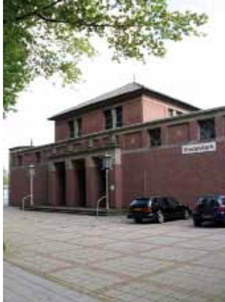
Goed bezochte Vredeskerk Tilburg (Parochie De Bron) samenvoegen met 't Goirke en onttrekken aan de eredienst?

Daarom heeft de kerkelijke wetgever bepaalde voorwaarden aan kerksluiting gesteld, waarvan de eerste is dat er ernstige redenen voor aanwezig moeten zijn, bijvoorbeeld dat er geen priester aan de kerk verbonden is of er geen gelovigen zijn. Momenteel komen kerksluitingen vooral voor in het kader van een reorganisatie van de parochies. Het beleid dat daarbij gevoerd wordt is vooral afhankelijk van het reorganisatiemodel dat daarbij gehanteerd wordt. Als het gaat om een samenwerkingsverband waarbij de bestaande parochies gehandhaafd worden blijven in principe de kerkgebouwen in gebruik. Wel komt het voor dat binnen een dergelijk verband enkele parochies worden samengevoegd, waarbij een van de kerken in gebruik blijft en de andere een speciale bestemming krijgt of wordt gesloten. Een ander model is dat de parochies van een regio samengevoegd worden tot één nieuwe parochie. In dat geval worden één of enkele kerken aangewezen als eucharistische centra waar de vroegere parochies gezamenlijk vieren.