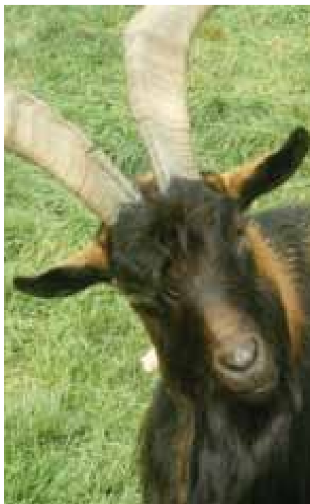
Bè bè bokkie bokkie bè of ... zondebok?

Dat geeft problemen. Was er geen rem, dan werd het in een mum van tijd oorlog van allen tegen allen. Maar gelukkig is er onze cultuur, waarvan de moraal een niet weg te denken onderdeel vormt, als rem. Moraal is gedrag-dat-hóórt wat door toedoen van onszelf in de loop van de tijd is gegroeid; anders was het een rotzooitje geworden! Gaandeweg is die moraal uitgegroeid tot een bovenpersoonlijk geheel van gedragingen. Die zijn ons geboden, als we tenminste het onderlinge geweld in toom en als samenleving het hoofd boven water willen houden en daarbinnen ook als gelukkige mensen functioneren.