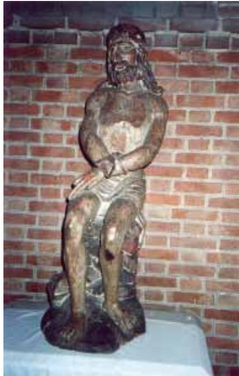
Christus op de koude steen, Gemonde

Hun grootste les voor iedereen Min God, de ander, als je eigen Daarvoor is 'Ken jezelf' vereist