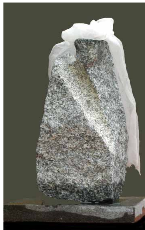
Deze Praagse Muze mijn weerstation ...

dag van de heilige Margaretha in ons achterhoofd. 'Heeft Margaretha geen zonneschijn, dan zal het een natte zomer zijn' en 'Regen op Sint Margriet geeft zes weken boerenverdriet'. Het tegenovergestelde geldt ook: 'Regent het op Sint Margriet niet, dan regent het zes weken niet'.