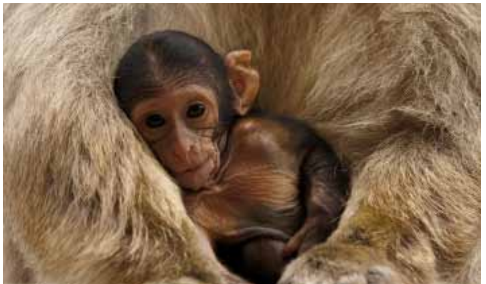
Zo vredig, zo veilig ... Het na-ape waard!

Mensen, stil van binnen, verdragen stilte buiten.