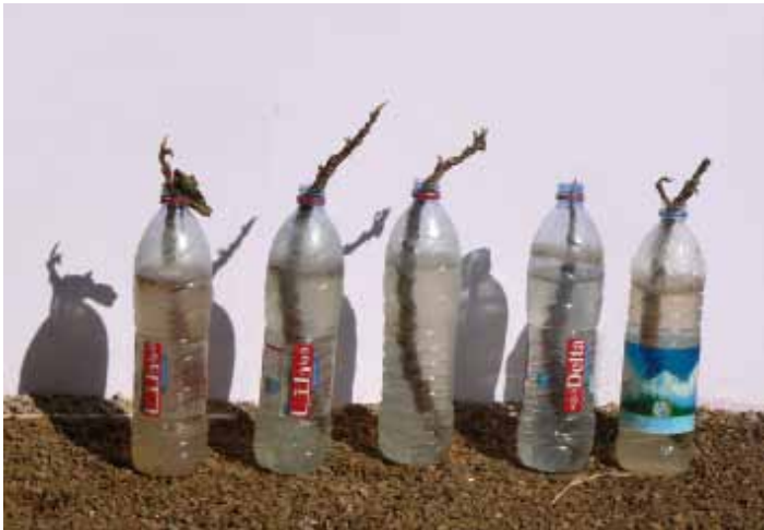
Stekken met de middelen die je hebt

Stichting Hadiyareizen zorgt voor laptop en printer. Stichting Kiek zal een financiële bijdrage leveren. Blijft nog een gat van rond de € 750,- in de begroting. En