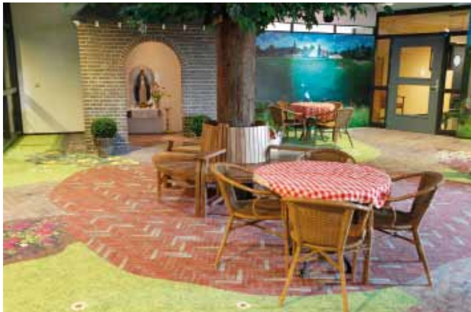
Belevingsplein voor dementerenden te Sint Anthonis.

De Mariakapel is een exacte kopie van de kapel die studenten vlak na de oorlog uit dankbaarheid in het dorp hebben gebouwd. Zij hebben ook nu weer zorg gedragen voor de bouw van de Mariakapel op het belevingsplein. Dit maakt deze