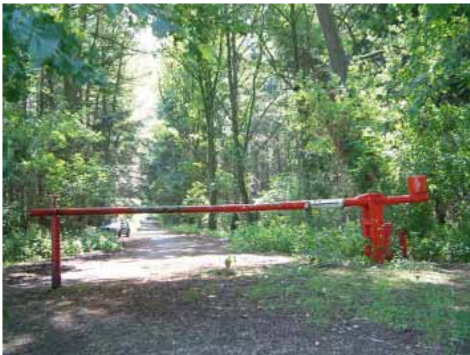
Grensovergang in Nationaal Park Meinweg

In april 2008 was hij er zo erg aan toe dat de mensen om hem heen vreesden voor zijn leven als zijn behandeling gestopt zou moeten worden. VLOT besloot - in het bezit van een stevige rapportage van de GGZ - een procedure te starten om in Nederland te mogen blijven i.v.m. de noodzakelijke behandeling. Een wrange situatie. Juist nu het zo slecht met John ging, was er wel kans op een verblijfsvergunning. Bewezen moest worden dat hij in zijn land van herkomst hiervoor niet behandeld zou kunnen worden. Er werd een afspraak gemaakt bij de betreffende instantie om de procedure op te starten. Hoewel hij erg blij was en zijn best deed, bleven de depressieve buien terugkomen.