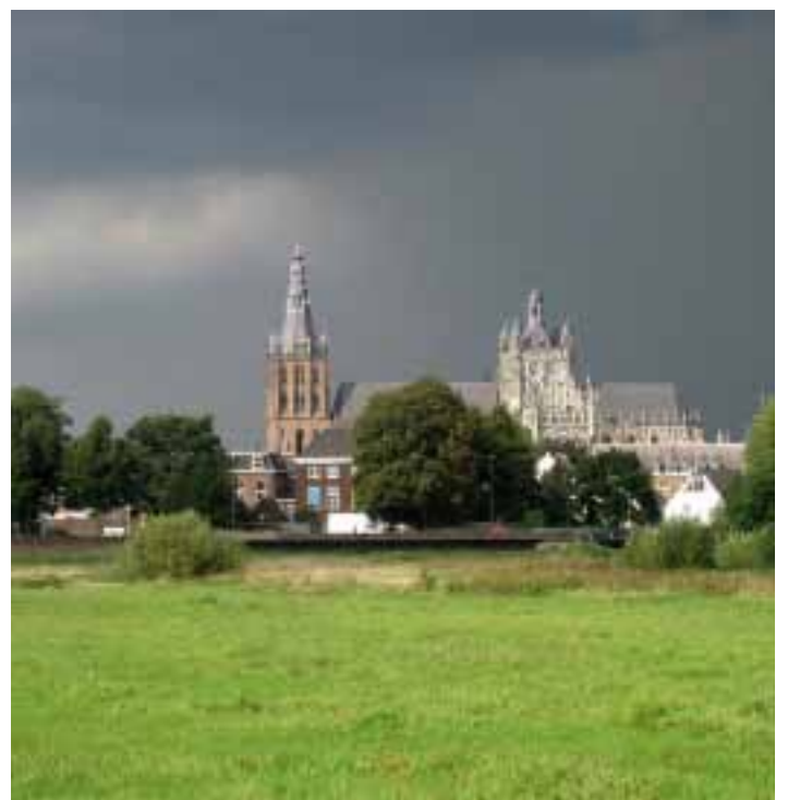
Donkere wolken pakken samen boven het Bossche Broek