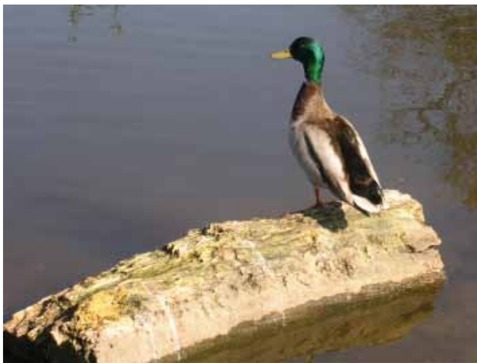
Deel van het geheel en tegelijk zichzelf