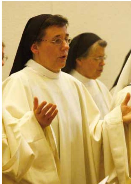
Bij het zingen van het Onze Vader

'Ondertussen deed ik mijn analistenopleiding en kreeg ik een baan op het lab. Maar heel gek! Die nachtelijke ervaring bij de Trappisten, waarbij ik contact met God had gevoeld, bleef aan me trekken. Een jaar later ging ik er nog eens een weekend doorbrengen en weer werd ik geraakt. Enkele jaren later ben ik eens naar de Trappistinnen geweest en daar had ik een gesprek met de novicenmeesteres. Ze zag goed wat er in me omging. Ik was helemaal van streek. Zou God me dan toch in het klooster willen hebben? En stel dat ik daar ja op zou zeggen? Terwijl die vraag bleef hangen, ging ik ook eens kennismaken met andere, minder strenge kloosters. Zo was ik bij de Clarissen. Er