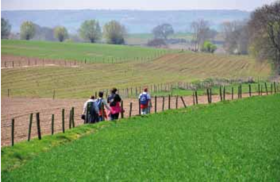
Vastenactie Pelgrimstocht 7-10 april 2011

De toevloed gedichten en gedachten rond Goede Week en lente was dit jaar erg groot. Vandaar een extra pagina met gedichten en gedachten in deze Roerom. Toch moesten er nog keuzes gemaakt worden en blijft een en ander liggen.