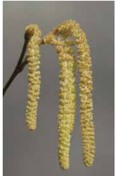
Elk seizoen een eigen gezicht

Iets voorbij het midden van de vorige eeuw werd de roep om een verstaanbare taal in de kerk en het zichtbare gezicht van de voorganger steeds luider. Er is geleidelijk voldaan aan deze terechte wensen van de mensen door de invoering van de volkstaal, de verplaatsing van het altaar richting het midden van de kerk en de plaats van de voorganger die zich oog in oog met de mensen opstelde. Er is een