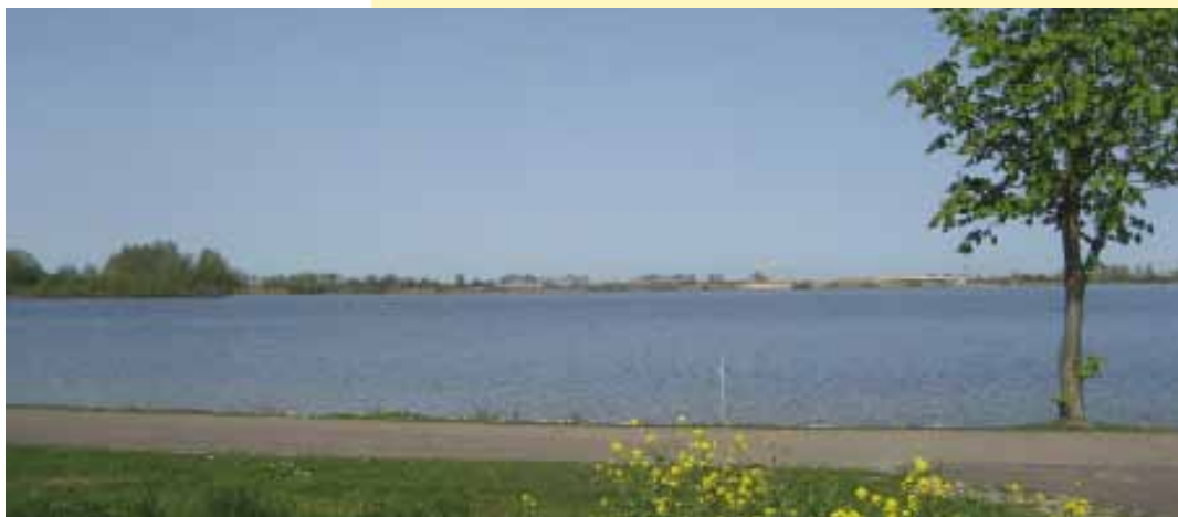
Engelermeer 's-Hertogenbosch