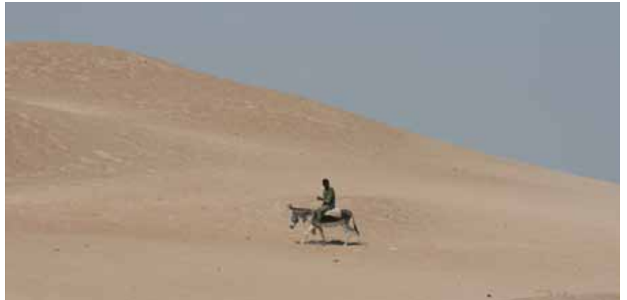
Aan de voet van de Nijldelta