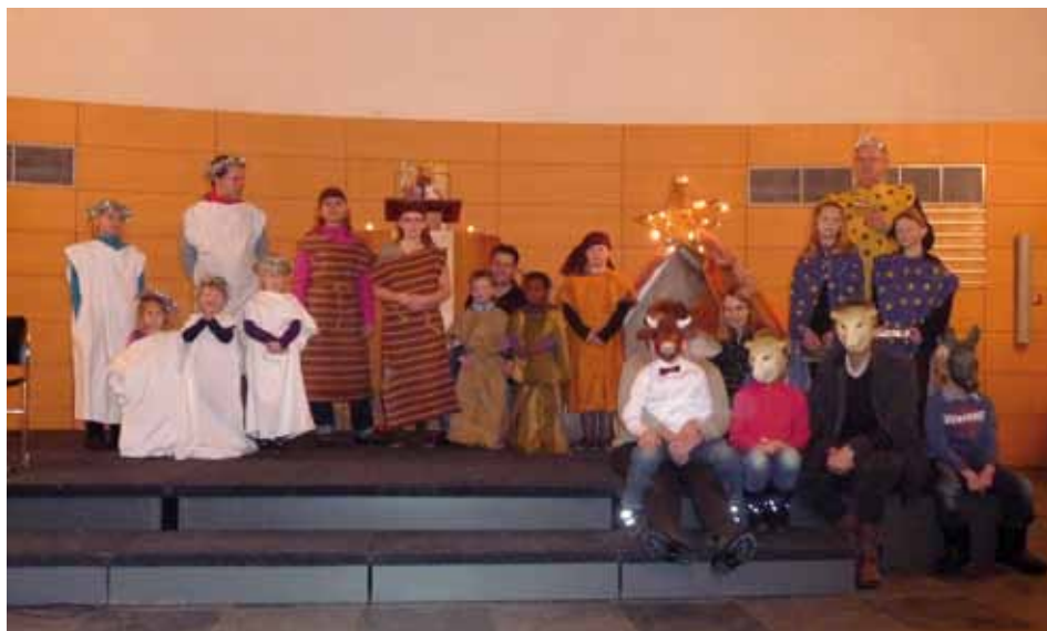
Kinderkerstdienst 2010 in Emmen