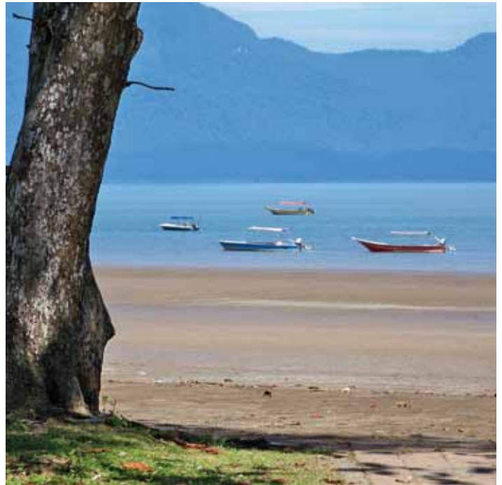
Voor 2011: Goede vaart in rustig water!

Johannes XXIII ten aanzien van het pausambt. Hij wenste niet door de St. Pieter gedragen te worden zoals zijn voorgangers. Baldakijn en baldakijn dragers waren niet meer nodig.