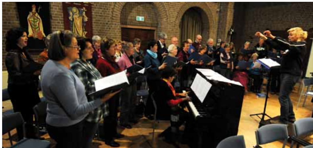
Viering in de Zijp in Arnhem

Nu we de grens van de 21 e eeuw ruim gepasseerd zijn, lijkt er een kentering te komen, want in de afgelopen jaren lijkt te gebeuren wat iedereen rond 1970-80 had verwacht. Op veel plaatsen in het land ontstaan en groeien vrije-opstelling kerken, ook wel Ecclesia's genoemd. Veel van die Ecclesia's vinden hun inspiratie in de liederen van Huub Oosterhuis of in de wijze waarop in de Dominicusgemeente Amsterdam gevierd wordt. Op veel plekken zijn er ook bijbelgroepen en leerhuizen gekoppeld aan de regelmatige vieringen die gehouden worden. Zo wordt er in Veldhoven sinds enige jaren een maandelijks leerhuis georganiseerd door Leerhuis en Liturgie Brabant in nauwe samenwerking met Leerhuis & Liturgie Amsterdam . In 2000 startte in het Friese Wognum de West-