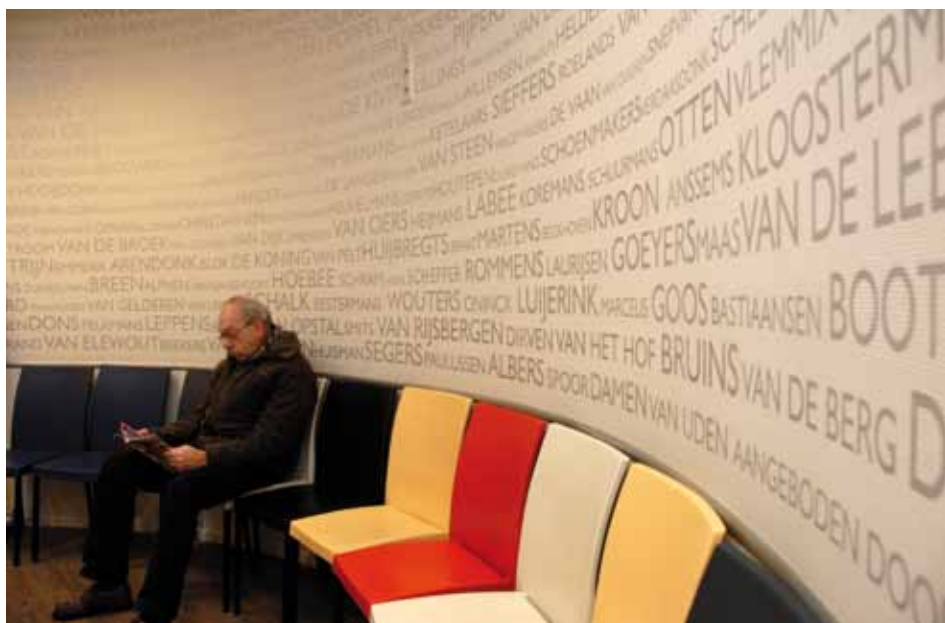
Wachtruimte van Gezondheidscentrum Tolakker in Bavel

naam in een verhaal komt te zitten. Het gaat dan vaak om achternamen en soms ligt het zomaar voor het grijpen, als je er oor en oog voor hebt. Voorbeelden? Kijk naar Kunst & Kitsch en je weet meteen waarom dit zo'n succesvol programma is. Het team van experts bestaat onder andere uit: mevrouw Zilverberg, meneer Aarde-werk, Welkenhuyzen, Scheurleer en Akkerman. En met de winterperikelen in december zag en hoorde ik sneeuwschuiver Potgraven langskomen, journalist Godfroid vanuit een goddelijk koud Albanië en meneer Rookhuyzen, die toevallig niet van de brandweer, maar korpschef bij de politie is. En tot slot: CDA-kamerlid Omtzigt gaat zich de komende tijd sterk maken voor een beter toezicht op de handel en wandel van Goede Doelen. Ik voorvoel dat vele organisaties hun naam gaan zuiveren.