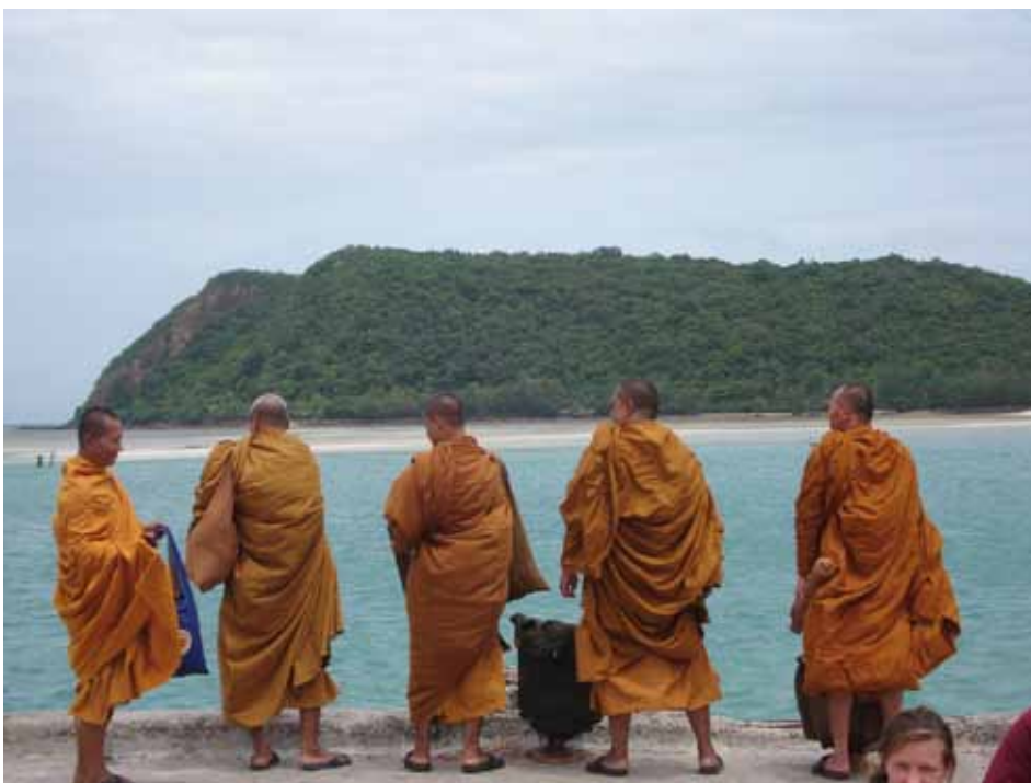
Monniken in Thailand die de boot niet willen missen

De uitdaging van de zoektocht en invulling van de identiteit van het christendom biedt mijns inziens meer mogelijkheden. Er is ruimte en tijd voor de christelijke God, maar alleen buiten de dialoog. In gesprek zal een christen altijd de waarheidsclaim verdedigen. Het heeft op zijn minst iets weg van starheid en in het ergste geval klampt men zich vast aan dogma's. Ik geloof, dat God zich niet laat vangen leerstellingen. God laat zich zien door de tijden heen, Hij komt ter sprake in gewone mensenlevens. Traditie is geen stilstand, maar een dynamisch proces met de jaren mee teneinde God een levende God te laten zijn. Hernieuwen in plaats van verabsoluteren lijkt me het speerpunt en vormt daarom de identiteit van het christelijk geloof. Het hernieuwen gebeurt waar mensen vanuit hun eigen context en beleving blijven verhalen over God. Christenen staan voor de uitdaging de geslotenheid van het systeem te doorbreken.