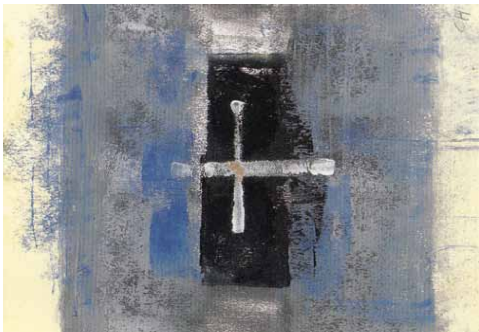
Retraite rond Aswoensdag

Zoals reeds kort vermeld in het decembernummer is op 3 december 2010 in Nieuw-kuijk een nieuw centrum van spiritualiteit geopend. Op het terrein van de cisterciënzerabdij Mariënkroon realiseert de Focolarebeweging het nieuwe conferentiecentrum Mariapoli Mariënkroon. Focolare is een internationale kerkelijke beweging die zich in alle delen van de wereld inzet voor sociale cohesie en de oecumenische en interreligieuze dialoog. Het centrum wil programma's bieden voor mensen van verschillende levensstaat, leeftijd en kerkelijke of religieuze achtergrond. De dragende kracht ervan bestaat uit een permanente christelijke gemeenschap van gezinnen, jongeren, alleenstaanden en religieuze leefgroepen. Het conferentiecentrum biedt ook ruimte aan externe groepen. Zie: www.focolare.nl en www.marienkroon.nl