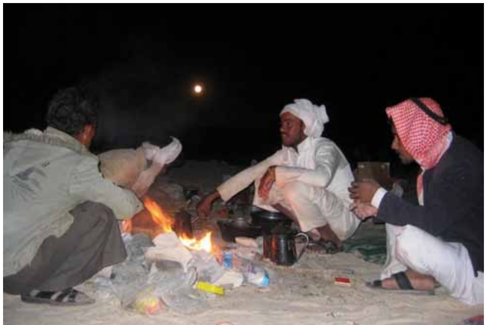
Bereiden van een maaltijd in de woestijn

Reageren? Info@hadiyareizen.nl Meer informatie over reizen in de Sinai-woestijn zie: www.hadiyareizen.nl