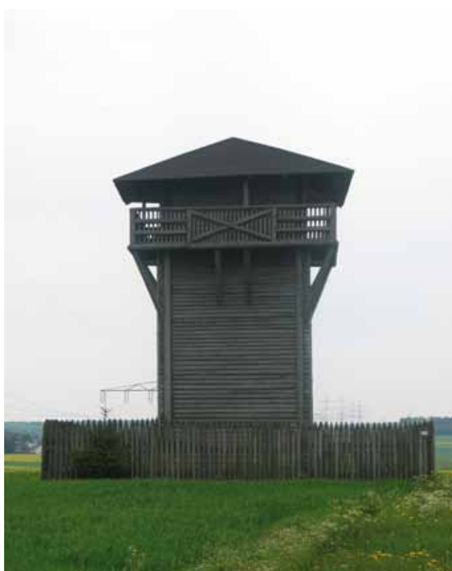
Burgsalach houten wachttoren 1

de belijdenissen gaan over iemand die als een hond gekruisigd werd omdat hij glashard de wantoestanden van zijn samenleving durfde noemen. Ook de eucharistie zingt volop met Ezechiël mee. Bij die groepsmaaltijd wordt door de gekruisigde van hierboven voorgezongen dat ook zijn tafelgenoten niet bang moeten zijn zichzelf als brood en wijn te laten breken en delen voor het welzijn van allen ... Eucharistie is ook in 2011 geen vrijblijvend ritueel. Het is een trainingsschool voor wachtposten! Men viert, leert en gedenkt er Jezus' zelfgave om zelf, in eigen samenleving, tot zelfgave te komen. Daar kom je niet toe door altijd je mond te houden.