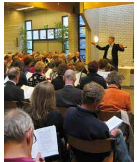
Samenkomst Haagse Dominicus

Op initiatief van Huub Oosterhuis, die in februari zijn nieuwe huis De Nieuwe Liefde opent in Amsterdam, is er op 26 maart a.s. voor het eerst een ontmoeting tussen alle Ecclesia's in Nederland en Vlaanderen. Deze ontmoeting zal plaatsvinden in Amsterdam, waar alle dragende krachten en initiatiefnemers elkaar ontmoeten en nadenken over de vraag hoe ze elkaar kunnen versterken, wat ze te bieden hebben aan elkaar en hoe kwaliteit gewaarborgd wordt. Maar vooral zal deze dag het karakter hebben van, voor velen, een eerste kennismaking met elkaar en het uitwisselen van ervaringen. Bij voldoende behoefte zal dit een regelmatig terugkerende ontmoeting worden.