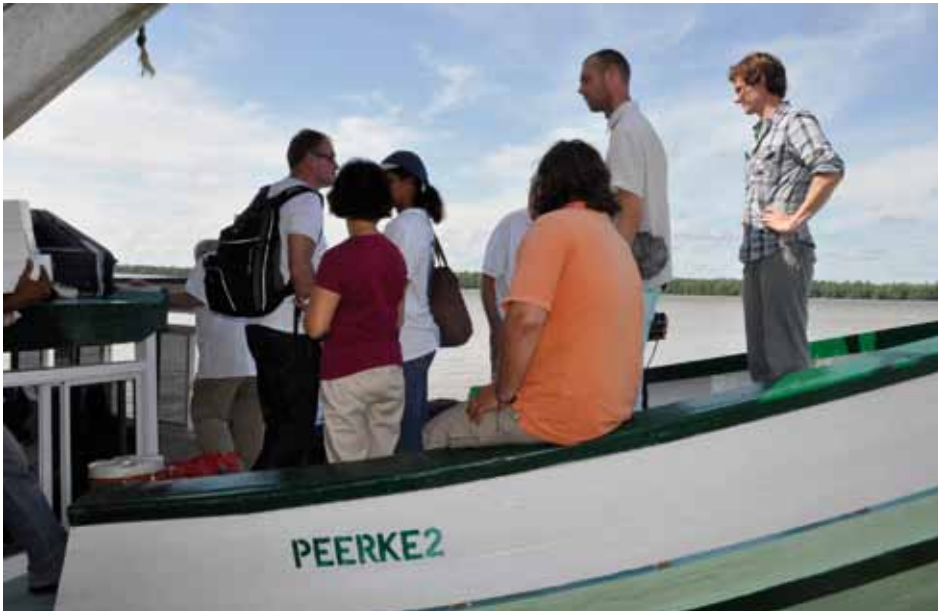
De pelgrimsboot Peerke 2 naar Batavia