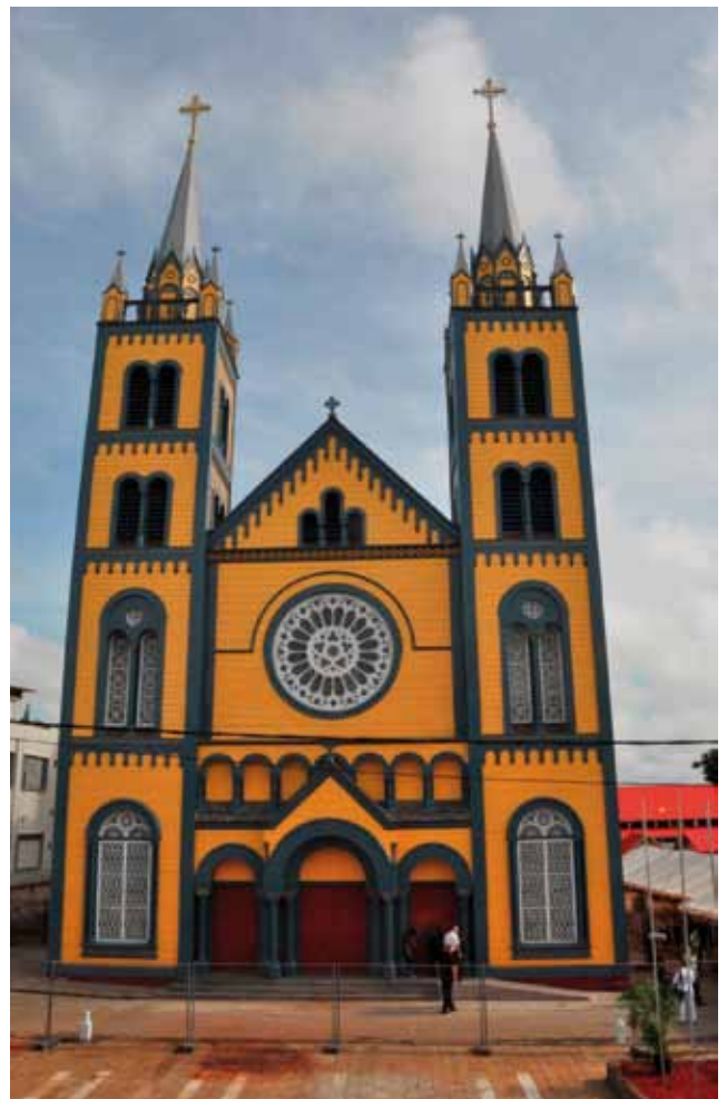
De gerestaureerde Petrus en Paulus kathedraal in Paramaribo