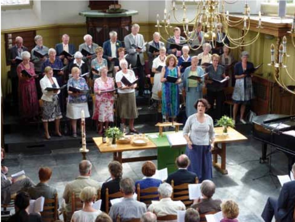
De Westfriese Ecclesia in het Friese Wognum

friese Ecclesia. Drie jaar geleden startte in Arnhem De Zijp. In 2010 gingen Ecclesia Breda, Stichting oecumenische vieringen Eindhoven (SOVE) en de Haagse Dominicus van start. De meeste plekken komen maandelijks samen om te vieren, veelal rond Schrift en Tafel, op sommige plekken alleen rond de Schrift. Diverse groepen overwegen eenzelfde stap. Alleen al bij de vieringen van de Ecclesia Breda zijn zo'n vijf groepen uit het hele land komen kijken om inspiratie op te doen en te brainstormen over hun eigen Ecclesia. Vlaanderen kent eenzelfde ontwikkeling. Ook daar groeit het aantal Ecclesia's snel. De Dominicus Gent is de oudste en bekendste; inmiddels hebben ook Lier, Brugge, Kortrijk en Antwerpen hun eigen Ecclesia.