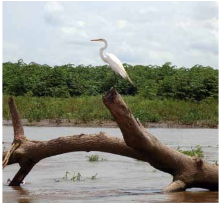
Je prepareren op een nieuwe start Witte reiger, Costa-Rica

Dit gemis brengt mensen ertoe hun toevlucht te nemen tot verdovende surrogaten, die - daar zijn ze surrogaat voor - nooit helemaal voldoen. Hierom zijn voor hem de avonden te kort geworden om een feest te vieren en gezelligheid te kweken; het