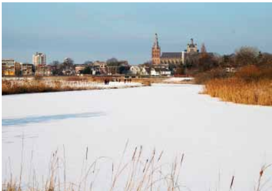
Vanuit het Bossche Broek

De spiritualiteit van de hedendaagse westerse religieus beweegt zich in de richting van deze eenheidservaring, waarop De Roerom in maart 1997 al wees in de bij-