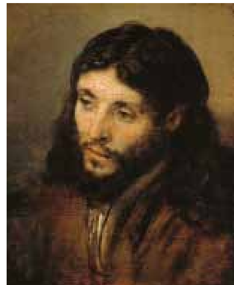
Rembrandt van Rijn Hoofd van Jezus , 1648, Gemäldegalerie Berlin

heeft hij het brood gebroken en 't leven gedeeld met die bij hem waren; hen zijn beker overgedragen en Gods belofte te doen gegeven. Zijn testament voor eens, voorgoed.