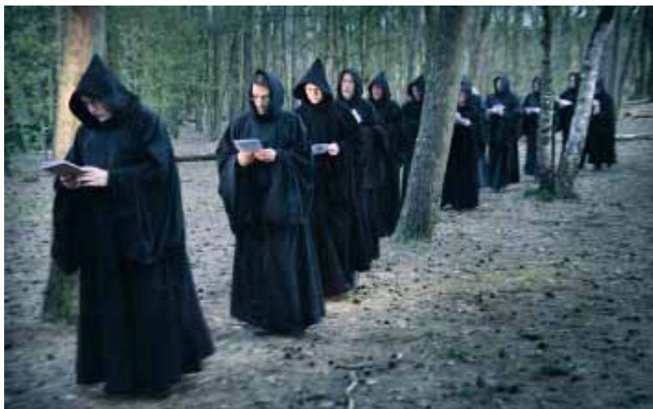
Monniken in Sint Walrick, Overasselt

Website van het Werkverband van Katholieke Homo-Pastores voor informatie over doelstelling, activiteiten en recente standpuntbepalingen van het WKHP: www.homopastor.nl