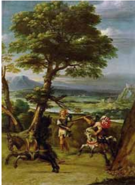
Giovanni Battista Viola (1567 - 1662), Het einde van Absolom, Geill. Bijbel 214

Het scheppingsverhaal zegt dat het groene veldgewas vooral voor de dieren zou dienen, terwijl de mens van het vruchtdragend gewas en de boomvruchten zou genieten. Door het eten van de verboden vrucht werd deze harmonie verstoord. De mens zou voortaan met moeite en in zweet de grond moeten bewerken en behalve boomvruchten ook groen gewas moeten eten. Uit Genesis blijkt, dat de mens zich al vroeg op de akkerbouw heeft toegelegd. Daarbij werden ook boomgaarden en wijnvelden aangelegd. Die werden het teken van welzijn en geluk. Waar in de Schrift een paradijselijke situatie of een glorieuze toekomst geschetst wordt, daar is altijd een overvloed aan schaduwrijke vruchtbomen. In het oude Israël waren er ook al vormen van natuurbescherming. Zo wordt in Deuteronomium het vernielen van vruchtbomen bij belegering verboden.