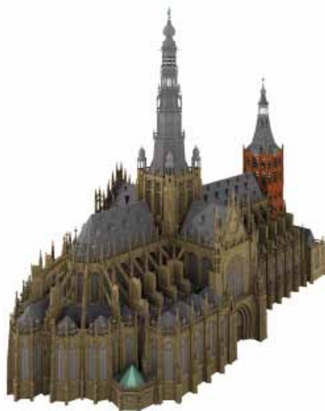
Bouw van de hoge vieringtoren (1521-1529)

de vormgeving en versieringen, ook in de mythe. In technisch opzicht is er inmiddels veel over het gebouw bekend, zijn raadselen rond herkomst, uitbreiding en datering verhelderd, maar de mythe blijft