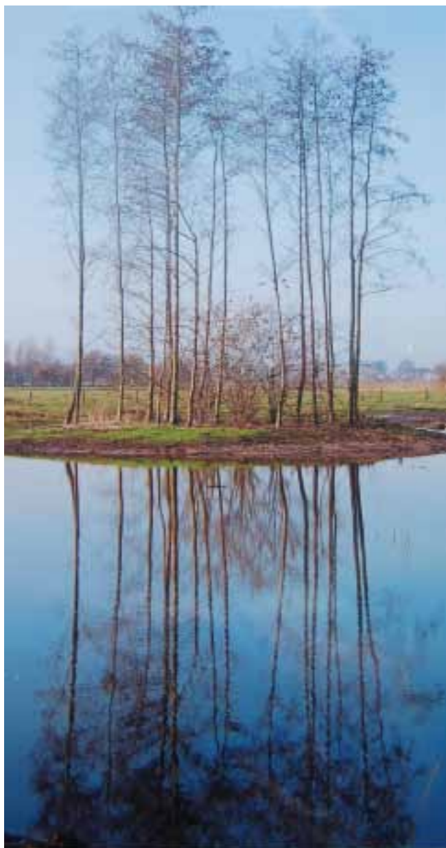
In het Bossche Broek

Vele pastorieën raken onbemand, de parochies worden onoverzichtelijk groot en dus verrijzen er parochiële trefcentra. Deze beperken zich vaak tot service rond de sacramenten en dan nog maar rond enkele daarvan. De parochiële pastorale centra dreigen meldposten te worden voor doop, eerste communie en uitvaarten, hoewel de kerkelijke viering hiervan ook op zijn retour is en er met name afscheidsvieringen buiten de kerk gehouden worden. Er worden 'afscheidscentra' geopend die voorzien zijn van een 'totaalpakket', inclusief afscheidsviering. Hier nemen mensen kennis van de mogelijkheden voor wanneer het zover is. Ze kunnen keuzes maken en hun naasten hiervan tijdig op de hoogte stellen, zodat deze weten waaraan en waaraf en moeilijk gedoe met een kerkelijke bedienaar wordt voorkomen. Er zijn ook bureaus voor advies en hulp bij geboorte, schoolverlating, liefde en trouw. Het is betreurenswaardig dat het leven vieren met deze ontwikkeling sterk