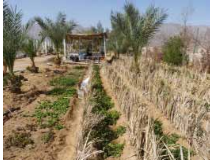
De ecoboerderij

maat, komkommer, aubergine en courgette, maar ook bietjes, rucola, lollo rosso en groene asperges. Alles nog als experiment en later, als een en ander goed aanslaat, voor de sjeke hotels hier en in Dahab. Ook wil hij groentepakketten voor expats gaan leveren, een idee dat hij door Nederlanders kreeg aangereikt.