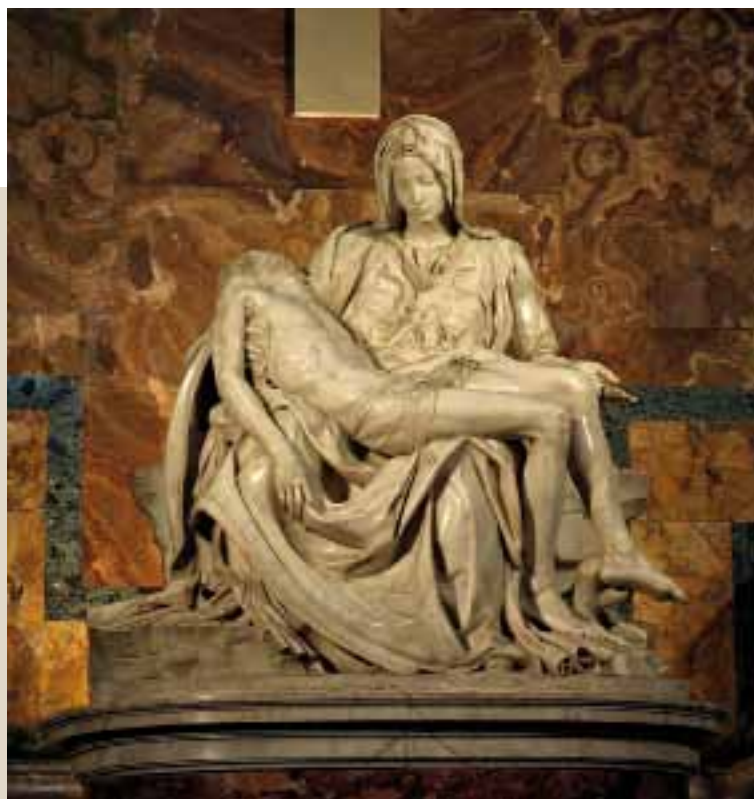
Michelangelo La Pietà , 1499, St. Pieter Basiliek, Vaticaanstad

Je ging met wie niemand wilde, kwam waar geen mens zich waagde. Je mocht gezien worden met mensen beklad en door 't slijk gehaald.