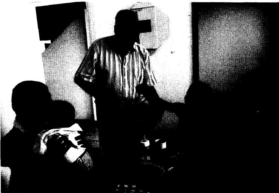
Fotovan de brochure Ten dienste van ... Woonwagenbewoners, Sinti en Roma in de samenleving