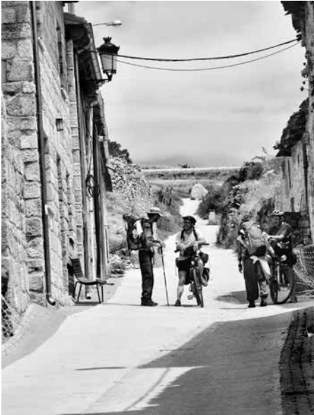
Pelgrims ontmoeten elkaar op de camino.