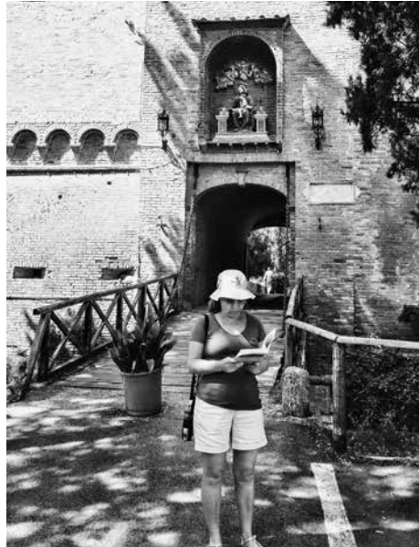
Toerist aan de ingangpoort van de abdij van Monte Oliveto Maggiore, Asciano (Toscane).

broeders elkaar (cf. RB 1). Immers, het doel van de weg toont zich niet in het gebouw van stenen, maar in de ‘levende stenen’ van de gemeenschap. Pelgrims delen die ervaring: ook al is hun tocht een heel persoonlijke onderneming, een weg naar hun eigen innerlijk, toch is de verbondenheid met andere pelgrims groot. Naar welk doel je ook op reis bent, je deelt het onderweg zijn met de mensen die je op je tocht tegenkomt.