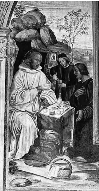
Sint Benedictus aan de feestdis met een bezoeker, fresco van Luca Signorelli (1445-1523) in de abdij van Monte Oliveto Maggiore, Asciona.

ook. Immers, een pelgrim heeft er alle baat bij om de veelkleurigheid en vreemdheid mee te maken, ook van de plekken waar hij vertoeft. Maar de herbergier kan zich wel spiegelen aan de kloosterling en omgekeerd. Het klooster dat we jaren geleden bezochten, was geen herberg in de letterlijke zin van het woord (we hebben er ook niet overnacht), maar het heeft onze verwachting van wat een goede plek is, wel gekleurd: voortaan zochten we de refuges waar ontmoeting mogelijk was en waar ieder de juiste eer bewezen werd. De camino leert wat een gepaste houding is, en dat kleine klooster diende zich aan als leerschool, voor pelgrim en monnik, inwonend of langskomend.