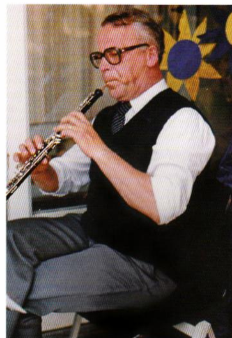
Fictser en hoboïst: zo iemand moet wel een lange adem hebben.