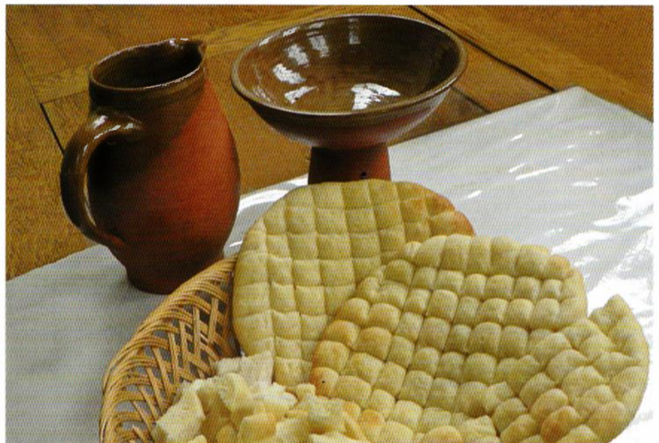
Brood en beker in Open Kerk Helvoirt.