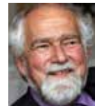
TEKST WIM WEREN