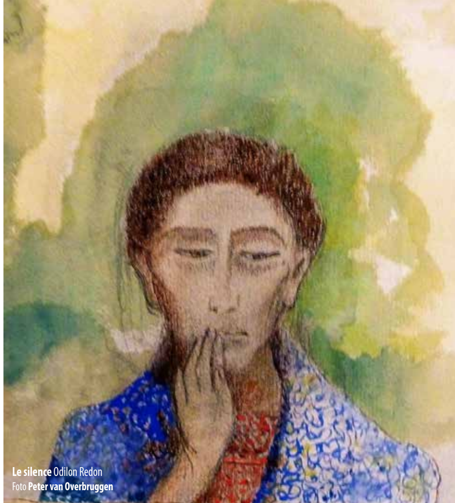
Le silence Odilon Redon