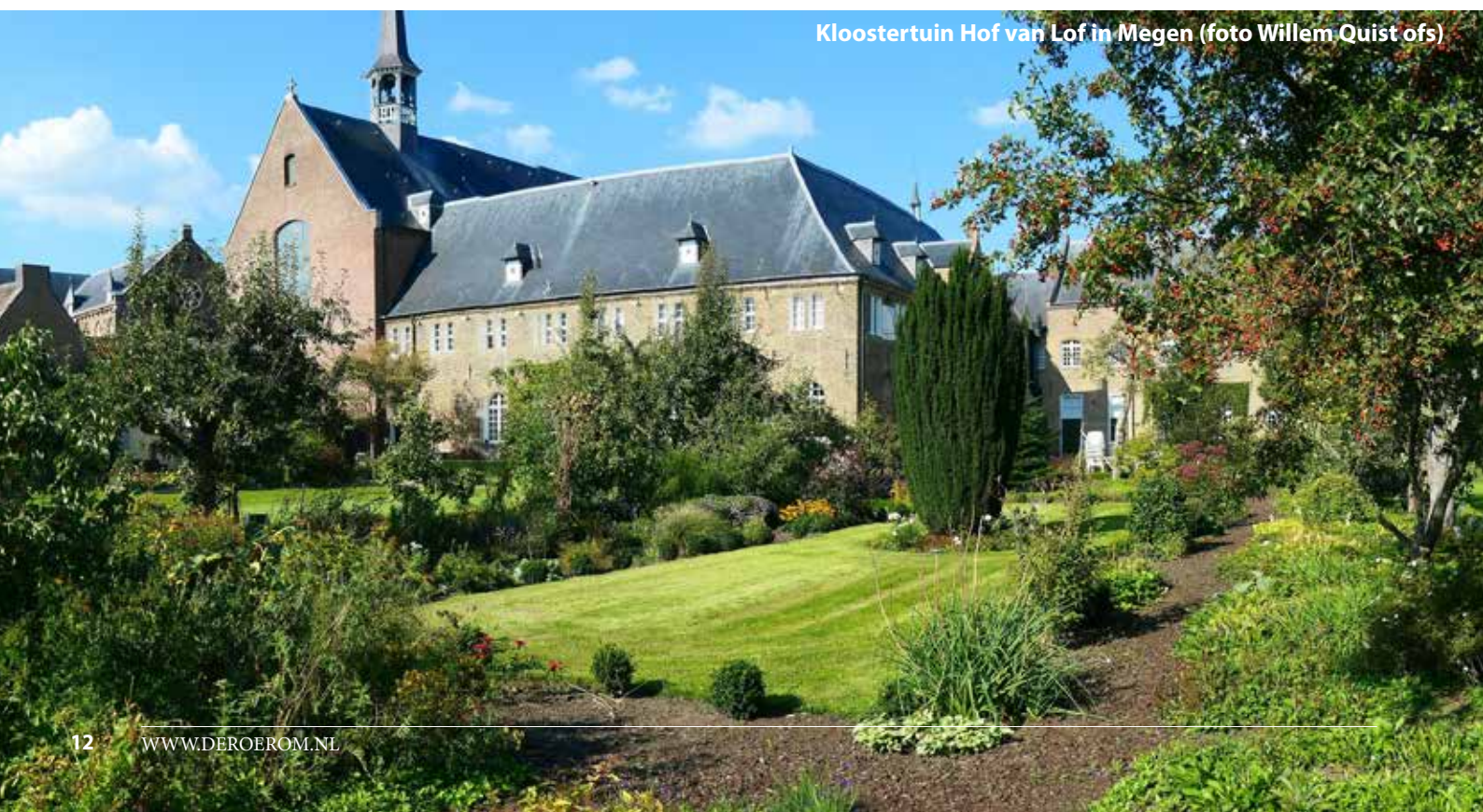
Kloostertuin Hof van Lof in Megen

Onder redactie van Wouter Prins, conservator van Museum Krona.