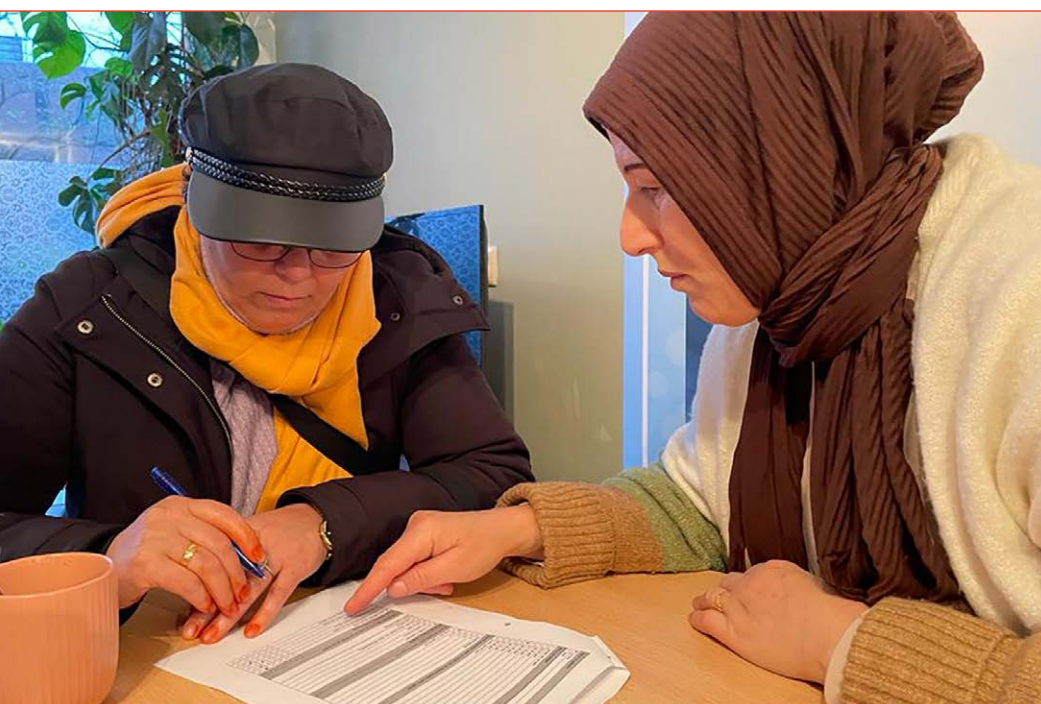
Hulp bij het invullen van papieren voor formele instanties

Dit zijn niet de mensen die gewend zijn projectaanvragen te schrijven en die digitaal in te dienen. Ze hebben een idee en willen daarmee aan de gang. Daar is wat geld voor nodig, maar ze zitten niet te wachten op allerlei administratieve rompslomp.